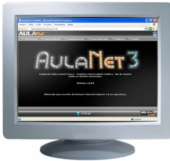
a) AulaNet 3.0 para Desktop

os procedimentos estabelecidos no processo RUP-3C-Groupware, fornecendo novos resultados para a melhoria deste processo.