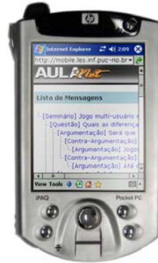
b) AulaNet-M para PDA