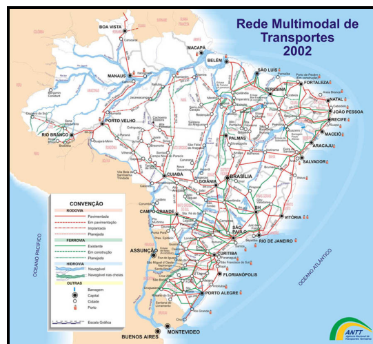
Figura 36: Mapa multimodal do território brasileiro