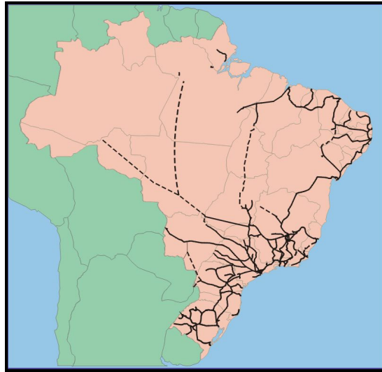
Figura 35: Mapa da malha ferroviária brasileira

O mapa abaixo ilustra a malha ferroviária brasileira.