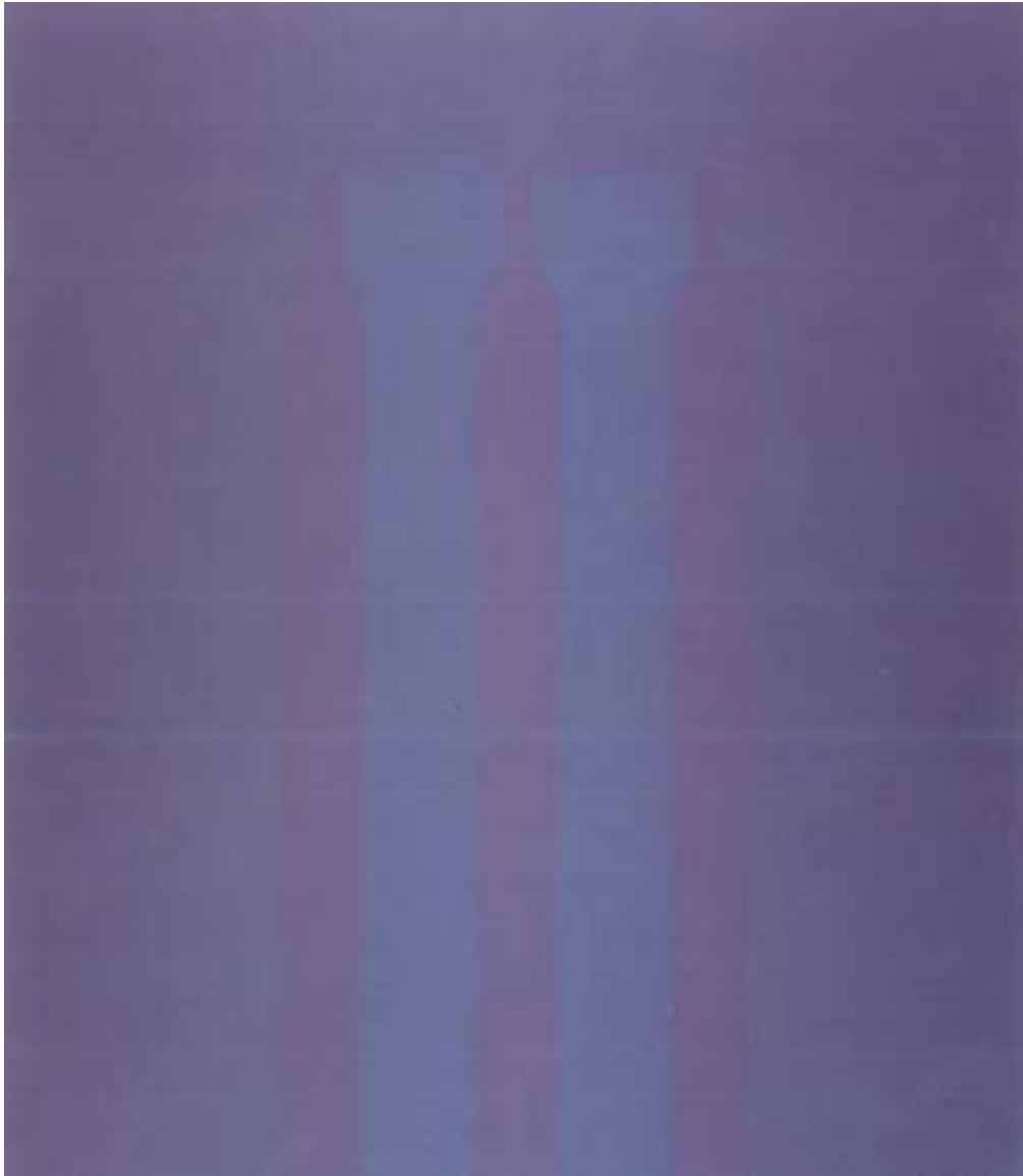
Figura 26 – Paulo Pasta. Sem título, 2001/2002. Óleo s/ tela - 220 x 190 cm

agenciadoras de imagens – apoiando-se para tanto, no acervo cultural socialmente compartilhado do qual extraem seus contornos e densidade. Do plano encharcado de cor, perpassado por uma contínua vibração cromática, assoma uma lógica perceptiva direcionada a uma experiência empírica – e, até certo ponto, “neutra” - do sujeito, que o faz rapidamente escapar de identificações ou projeções – impregnações as quais é submetido pelo caráter absorvente da cor. Se o olho é capturado e seduzido, instado a mergulhar nas camadas sucessivas de tinta como o sujeito que olha, analogamente, vivenciaria um desvelamento sucessivo de significados afetivos auto-esclarecedores, também é submetido a uma incerteza perceptiva cuja estratégia o aproxima de