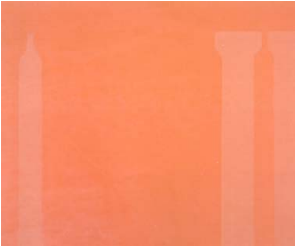
Figura 23 – Paulo Pasta. Sem título, 2002. Óleo e cera s/ tela - 180 x 220 cm

... Compreendi que, historicamente, a função de pintar grandes telas é pintar algo muito grandioso e pomposo. Entretanto, a razão por que as pinto ... é justamente porque quero ser muito íntimo e humano. Pintar um quadro pequeno é colocar-se fora da experiência, é olhar para uma experiência através de um estereoscópio ou de uma lente redutora. Seja como for que se pinte um quadro maior, quem o pintar estará nele. Não é algo que ele possa controlar. Pinto quadro grandes porque quero criar um estado de intimidade. Um quadro grande é uma relação imediata: leva-nos para dentro dele. 52