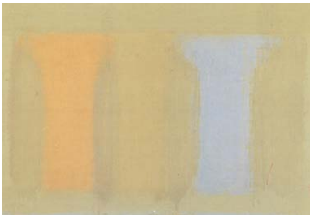
Figura 21 – Paulo Pasta. Sem título, 1962. Óleo e cera s/ tela - 24 x 30 cm

Como guardar – há algum algum, haverá um, algum algo algures, tranca ou trinco ou broche ou braço, laço ou trave ou chave capaz de res- guardar o belo, guardá-lo, belo, belo, belo... do des- gaste?(...) 45