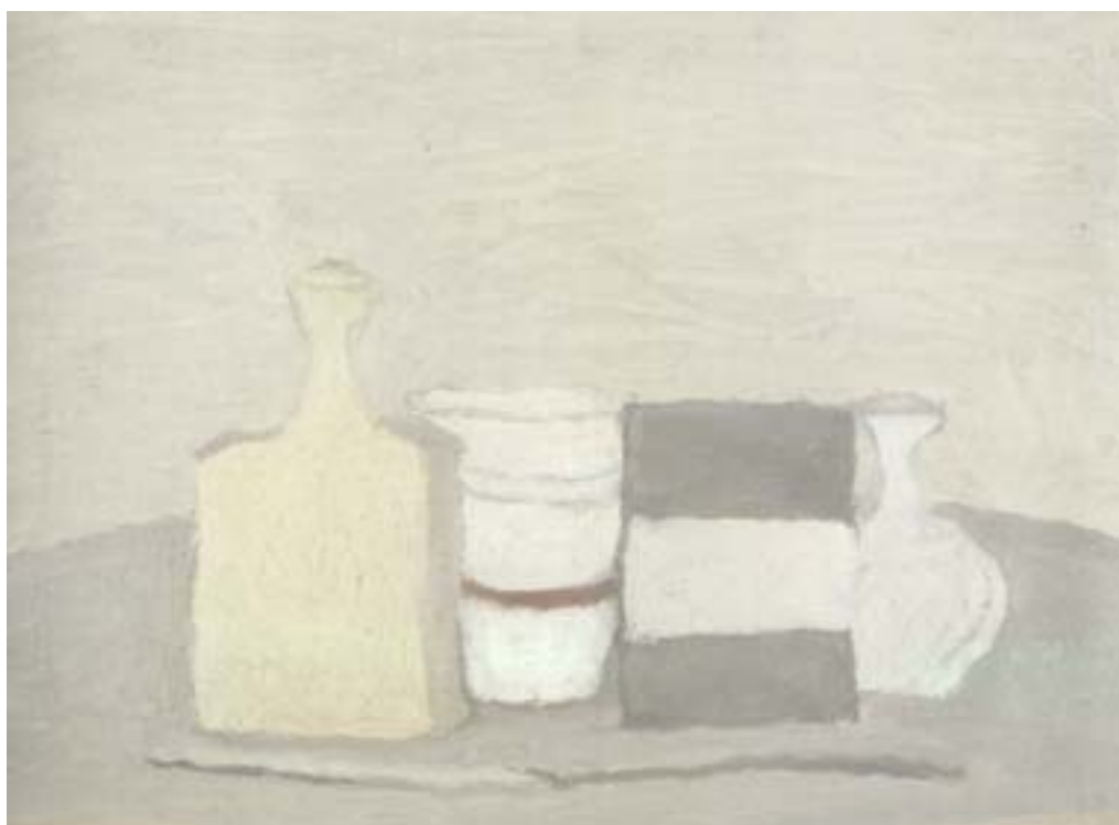
Figura 22 – Giorgio Morandi. Natureza morta, 1949. Óleo s/ tela - 35,5 x 50 cm

... apareçam sempre por inteiro, reduzindo drasticamente o jogo entre a parte e o todo. Vemos suas partes, seus signos (colunas, arcos), mas é o todo do quadro que floresce e matura, cioso de sua integridade. 49