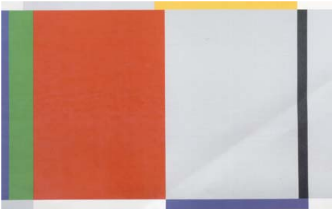
Figura 24 – Eduardo Sued. Sem título, 1985. Óleo s/ tela - 130,5 x 180,3 cm

...um certo paradoxo da visão. Aquilo é tão intenso que você tem dificuldade de focar o olho. Parece que é mais poderoso do que o olhar é capaz de receber. A evidência é essa intensidade, uma intensidade exagerada, exacerbada. 56