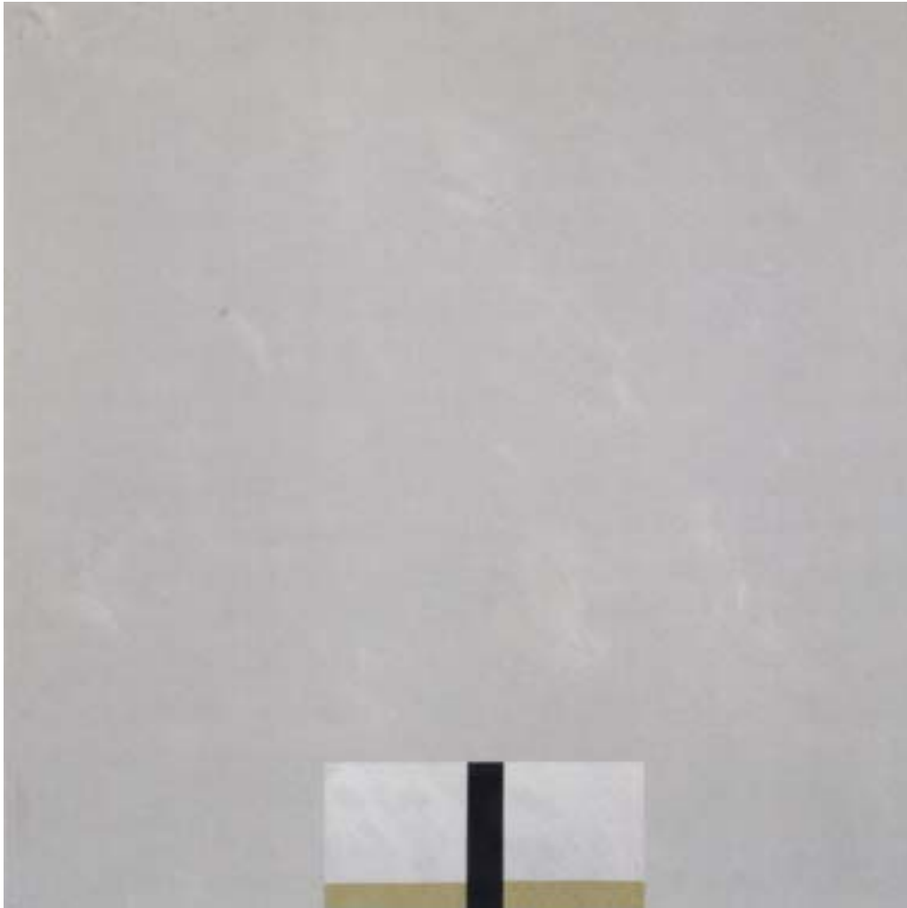
Figura 25 – Paulo Pasta. Sem título, 1994. Óleo s/ tela - 135 x 145 cm

Mas, como elas não se harmonizam entre si, sucede entre elas um certo extravasamento ...” 58 Mesmo quando parece reler Morandi por intermédio de Dacosta (figura 25), no dizer de Paulo Pasta 59 “a cor é ela mesma, nada além dela”. Em tudo diversas, as pinturas de Paulo Pasta, em jamais renunciar à introversão, fazem dessa qualidade uma força positivadora, a nos propor um intimismo que se exerce como acontecimento estético capaz de estabelecer inúmeras mediações: “colunas” e “garrafas” (figura 26), reduzidas a silhuetas auráticas, potencializam um território imagético próprio, situado a meio caminho da economia formal do signo e da amplitude alusiva do símbolo. Da maneira como nos são oferecidas à percepção, essas “não-imagens” tornam-se