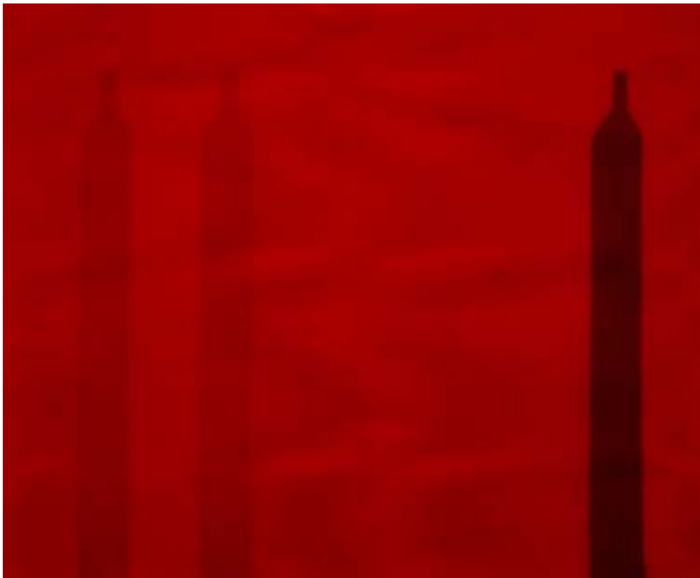
Figura 27 – Paulo Pasta. Sem título, 2002. Óleo s/ tela - 180 x 220 cm

Mas a multiplicidade combinatória efetivada pelas “colunas” e “garrafas” não se põe a serviço de uma lógica concreta: ao promoverem uma espécie de deslizar de horizontes perceptivos, os elementos como que estendem o plano pictórico, expandindo-o horizontalmente (figuras 23 e 27). Na efetivação desse alargamento do plano, ainda que não se aproximem do “all-over” proporcionado pela collor field painting de Rothko, as pinturas se espacializam de modo muito mais intenso do que as realizadas em menor formato.