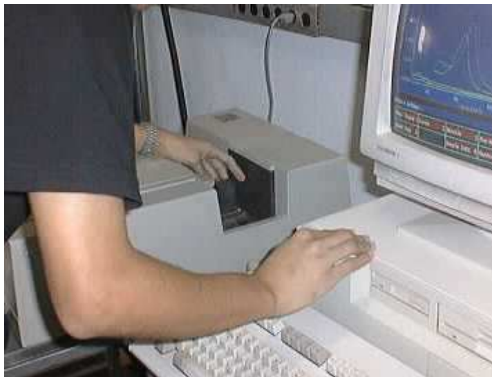
Figura 5.1 Fotografia do Espectrofotômetro HP-8452A, Hewlett-Packard.

Rio). Esse espectrofotômetro tem sistema de detecção por arranjo de diodos e resolução de 2 nm. O tempo de integração dos espectros registrados foi de 1 s e foram utilizadas cubetas de quartzo com caminho ótico de 1,0 cm e capacidade de 3,0 ml.