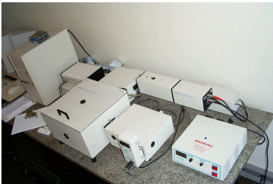
Figura 5.2 Fotografia do Sistema de Fluorescência QM-1 da PTI - Photon Technology International.