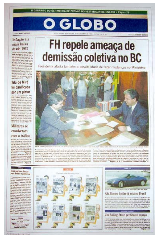
Figura 8: Primeira página de O Globo do dia 20 de dezembro de 1995 quando começou a circular o novo projeto gráfico.

No livro, O Globo Primeiras Páginas. 80 anos de história , que faz uma compilação de suas melhores capas, o jornal O Globo descreve assim a reforma de 1995: “o projeto gráfico resgatou algumas características daquele vespertino criado no Rio em 1925: manchetes com grandes títulos e variações de tipos de letras” (2005, p.188).