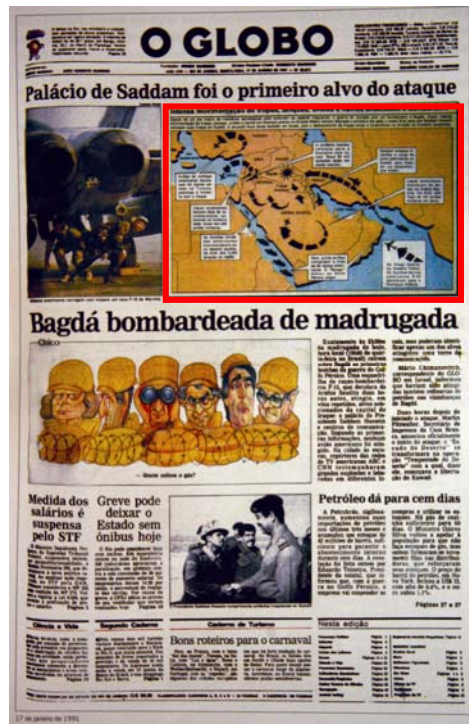
Figuras 9 e 10: Exemplos de páginas publicadas no dia 17 de janeiro de 1991, no início da Guerra do Golfo. Na página do jornal Folha de São Paulo , podemos notar o infográfico na parte inferior (destaque), e no jornal O Globo , o infográfico se localiza na parte superior (destaque).