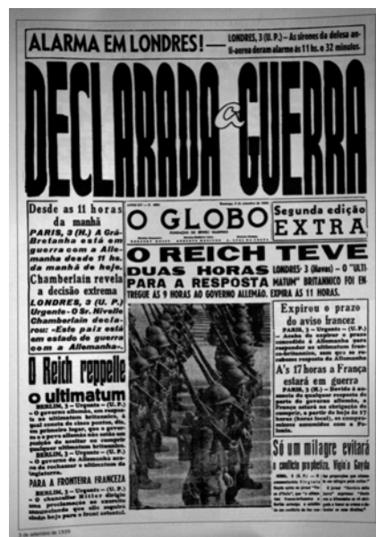
Figuras 11 e 12: Exemplos de páginas publicadas em outras guerras, onde ainda não é usada a infografia. Acima, à esquerda, a capa do jornal Folha da Manhã , do dia 2 de setembro de 1939, e à direita, capa do jornal O Globo publicada no dia 3 de setembro de 1939, ambas tratando do início da II Guerra Mundial.