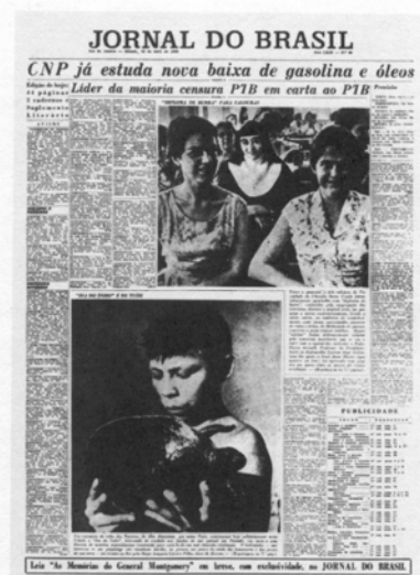
Figuras 5 a 7: Primeiras páginas do Jornal do Brasil, de cima para baixo: 12 de novembro de 1956, 11 de março de 1957 e 18 de abril de 1959.

Outra grande revolução visual foi realizada pelo jornal O Dia , em 1992. A barreira das cores estava definitivamente quebrada. O jornal saiu em cores em todas as páginas, o que era uma ousadia para a época já que, até então, os jornais trabalhavam com cores apenas nas capas e últimas páginas. O pai da ousadia foi