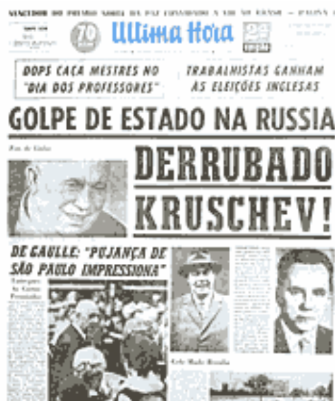
Figura 4: Primeira página do jornal Última Hora com seu logotipo azul.