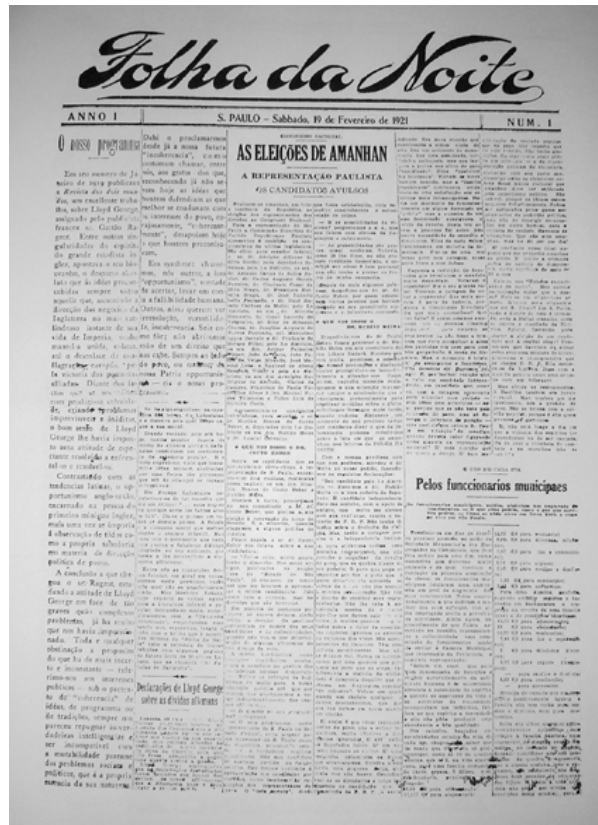
Figura 3: Primeira página do jornal Folha de Noite, de 19 de fevereiro de 1921.

Marshall Macluhan aponta que a imprensa em seu início tinha uma relação passiva em relação à notícia: os jornais esperavam a notícia vir até eles, elas “constituíam algo que estava fora e além do jornal” (Macluhan, 2003, p.240). Quando os jornais começam a perceber que só é notícia o que “sai no jornal”, eles também percebem que “as notícias deviam ser não apenas registradas mas também captadas”. (Macluhan, 2003, p.240)