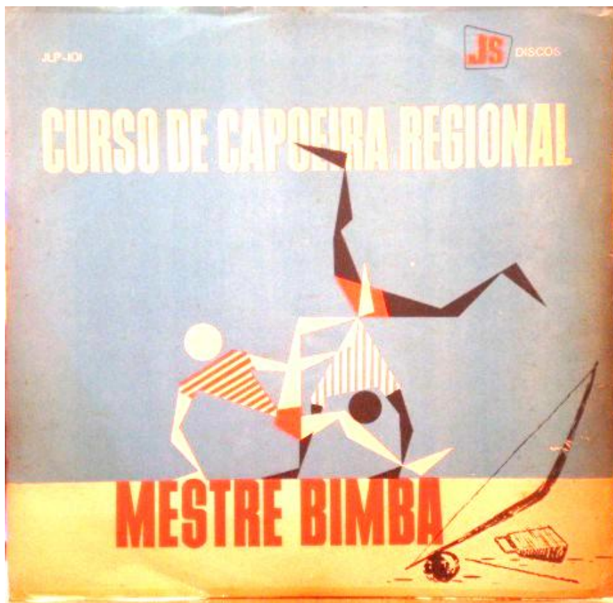
Figura 10 – Curso de Capoeira Regional , reprodução da capa.

Curso de Capoeira Regional tenha se dado nessa situação precária e lançado no ano de 1962, sendo posteriormente refeito em melhores condições, mas com algumas alterações, propiciadas pelo caráter espontâneo da música da capoeira.