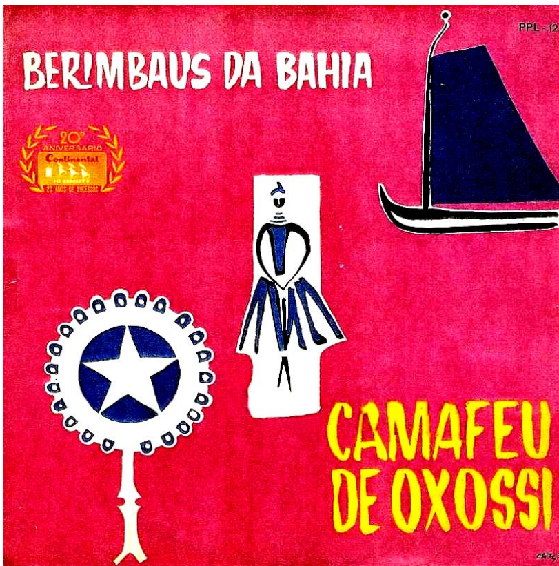
Figura 12 – Berimbaus da Bahia , reprodução da capa.