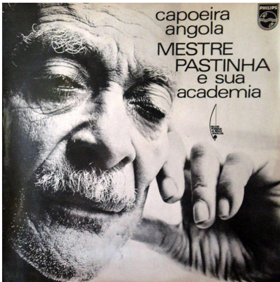
Figura 14 – Capoeira Angola, mestre Pastinha e sua academia , reprodução da capa.

(Figura 14) é o único, dentre os apresentados até aqui, cuja capa é uma fotografia do mestre ao qual se refere, mesmo sendo um disco que conta com a participação de vários outros instrumentistas e cantadores.