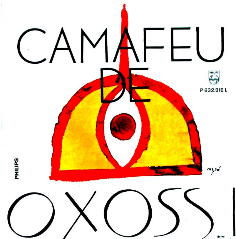
Figura 13 – Elepê Camafeu de Oxóssi , reprodução da capa.