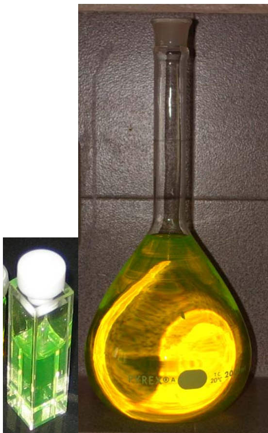
Figura 2.2 – Emissão fluorescente da fluoresceína em meio aquoso. Laboratório de biofísica e síntese, Instituto de Física, Pontifícia Universidade Católica do Rio de Janeiro.

Uma característica importante da técnica de fluorescência é a alta sensibilidade de observação. Dada esta sensibilidade, a fluorescência foi utilizada em 1877 para comprovar que os rios Danúbio e Reno eram conectados por correntezas subterrâneas. Esta conexão foi demonstrada adicionando-se fluoresceína no rio Danúbio. Após um período de sessenta horas, resíduos verdes fluorescentes apareceram em um pequeno rio que desaguava no rio Reno.