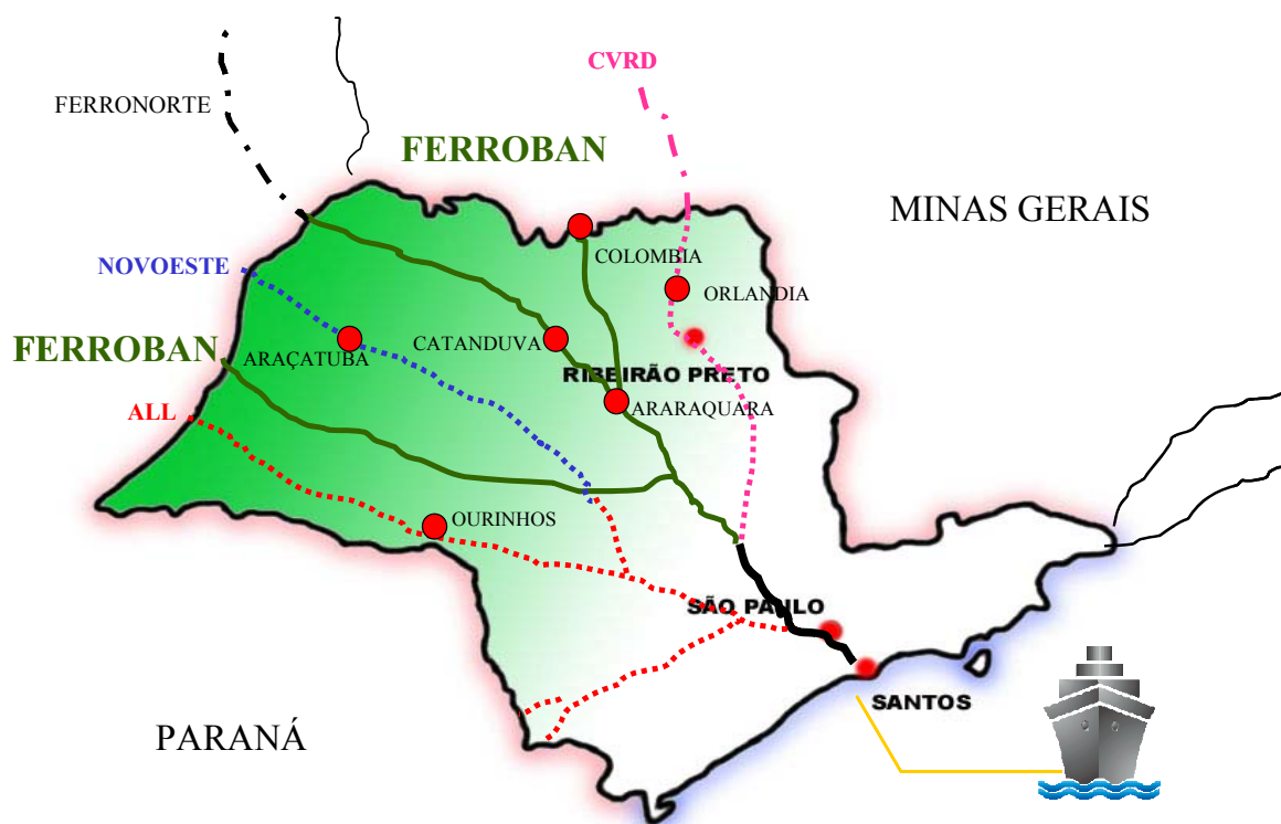
Mapa 2 – Malha Ferroviária Estado de São Paulo

O acesso do interior do estado de São Paulo ao porto de Santos via modal ferroviário pode ser realizado através de 4 companhias ferroviárias: ALL (América Latina Logística), FCA (Ferrovia Centro Atlântica), FERROBAN (Ferrovia Bandeirantes) e a NOVOESTE. Iremos a seguir mostrar o acesso dessas ferrovias no interior do estado de São Paulo.