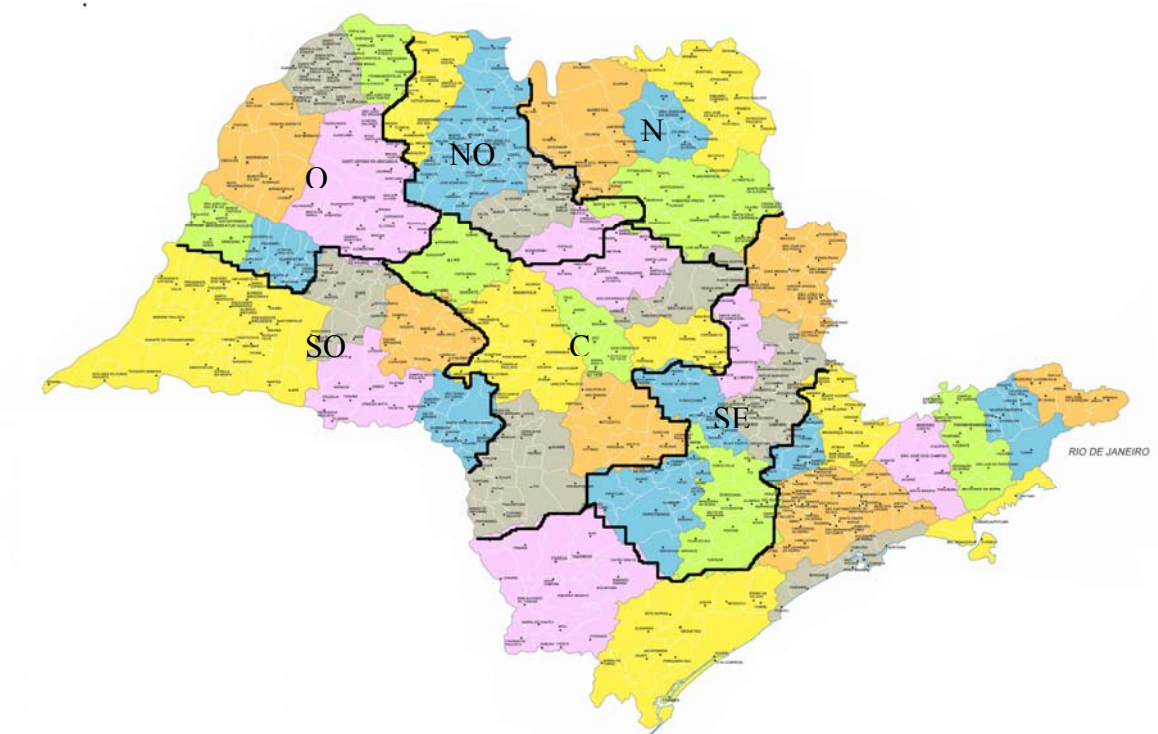
Mapa 1 - Divisões Regiões Produtoras

As principais zonas de plantação de açúcar são a Norte, Central e Noroeste. Juntas elas somam 64,3 % da área plantada com cana.