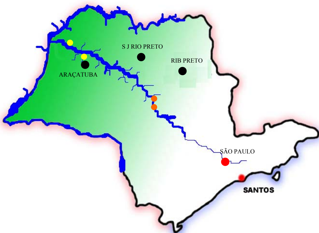
Mapa 4 – Hidrovia Tietê-Paraná