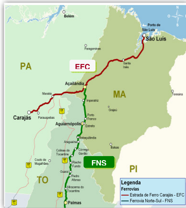
Figura 6: Mapa Ilustrativo da Estrada de Ferro Carajás e Ferrovia Norte-Sul

Com suas excelentes condições técnicas e equipada com a última geração de sistemas de controle, a EFC é uma das ferrovias com melhores índices de produtividade do mundo. A EFC foi concebida e construída para dar maior produtividade aos trens de minério, graças ao seu perfil e traçado moderno, com 73% de sua extensão em linha reta e 27% em curva, bitola larga (1,60m), raio mínimo de curva de 860m, rampa compensada máxima de 0,4% no sentido exportação, dentre outras características. (VALE, 2008)