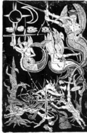
6.5 O Filho do Sol Francisco de Almeida Xilogravura.