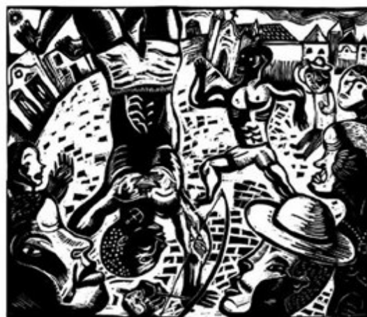
6.3 Imagem para o álbum Couro de Gato João Sánchez Xilogravura.