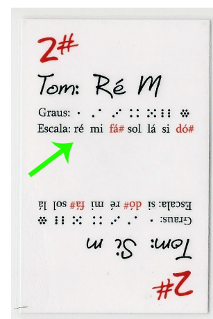
Figura 43: Carta da tonalidade Ré Maior, tom para o qual se faz uma transposição do jogo. Vê-se que a escala começa na nota ré, um tom à frente da nota dó, primeira nota do tom inicial. Como as notas não mudam de posição em relação umas às outras, todos os graus do novo tom correspondem cada um a uma nota um tom acima da que correspondia no tom de Dó Maior.