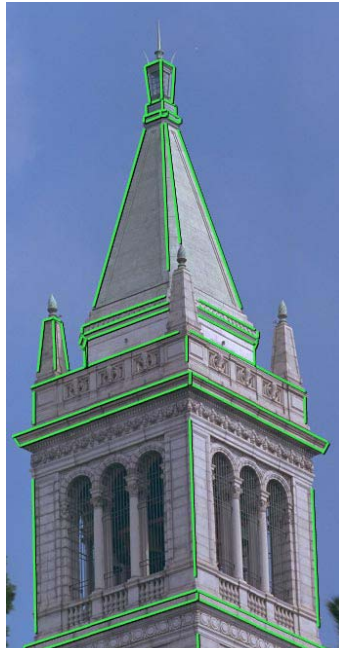
Figura 1.4: Exemplo de aplicação de realidade aumentada não interativa que utiliza marcações feitas pelo usuário para recuperar, dentre outras coisas, a câmera que gerou a imagem. Na imagem acima, as arestas em verde são marcações feitas por um usuário. A imagem foi extraída do trabalho feito por Paul E. Debevec em 1996 em sua tese de doutorado.

edificações, através de um casamento direto entre eles, utilizando uma única foto por vez e uma técnica semi-automática de reconstrução de câmera.