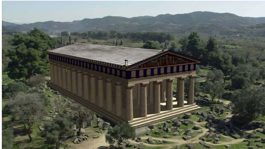
Figura 1.3: Exemplo de realidade aumentada aplicada a ruínas de edificações. Na imagem acima uma câmera virtual foi reconstruída a partir de marcadores eletrônicos para inserir o modelo do templo de Zeus, em Olympia, em sua aparência original. Projeto Archeoguide.

pretá-los como sendo partes conhecidas da cena. Através desse conjunto de características relacionadas, torna-se possível aplicar diferentes métodos para efetuar a reconstrução de câmera. Sendo assim, o principal problema a ser resolvido passa a ser como encontrar tais características relacionadas. Dependendo do tipo da aplicação, tempo real ou não interativa, pode-se utilizar estratégias diferentes.