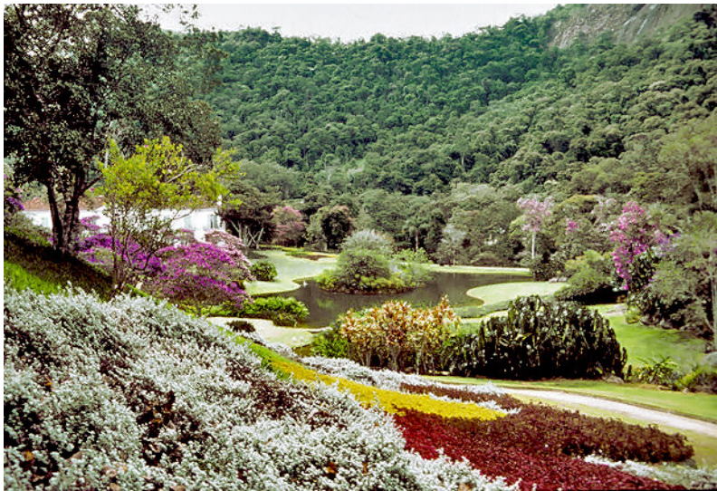
Imagem 5: Jardins da residência Odette Monteiro, Correias (1948)

Esta postura perante o mundo invoca uma natureza em obra, uma criação contínua e não finita. Está sujeita à instabilidade própria da natureza, diretamente relacionada à mudança da luz na cor e textura dos elementos, ao movimento do vento, possibilitando sempre novas realidades, abertas à experiência estética, e a novas releituras que possuem uma mobilidade constante, sempre imbuídas de novas significações e de novas descobertas.