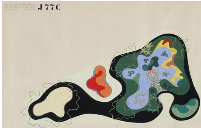
Imagem 1: Projeto para a Praça Saens Peña, Rio de Janeiro, 1948.

Isto não significa, no entanto, um aprisionamento rígido da gestualidade, mas o controle racional de uma estrutura aberta, capaz de direcionar a forma livre. Apesar do princípio morfológico geométrico, o espaço não é estático; ele está sempre em movimento e se constrói de maneira elástica, apresentando um modo de funcionamento interno que é orgânico, livre e não planejado, expressivo da vida, de tudo o que nasce, cresce, evolui e invade o espaço. Nesse sentido, o gesto de Burle Marx se aproxima do racionalismo empírico 16 de Alvar Aalto (1898-1976), que busca harmonia no conhecimento da realidade natural, na relação de ciclo entre as coisas e o espaço (como em seu projeto para Villa Mairea de 1938-1939), sem abandonar, no entanto, a precisão do projeto e o rigor da construção. Desta forma, o desenho livre contínuo e aparentemente intuitivo é vinculado ao desenho geométrico construído, mental e racional.