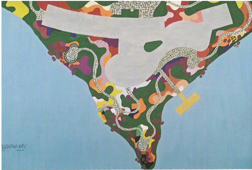
Imagem 4: Grande Hotel, Pampulha, 1942

pano de padrão moderno e colocadas sobre a grama. Essa afinidade com a arte contemporânea constitui o segredo dos jardins de Burle Marx. ” 18