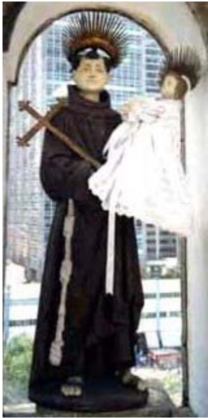
Figura 2 – Santo Antônio do Relento

Construída em terracota, a imagem do santo não possui a beleza artística das esculturas barrocas que vinham de Portugal e mesmo de outras produzidas na colônia. 104 (Figura 2) Iconograficamente, foi construída à maneira da maioria das imagens antonianas da América portuguesa: hábito franciscano, cordão com três nós, sandálias e tonsura. Com o braço esquerdo, segura o Menino Jesus, em pé,