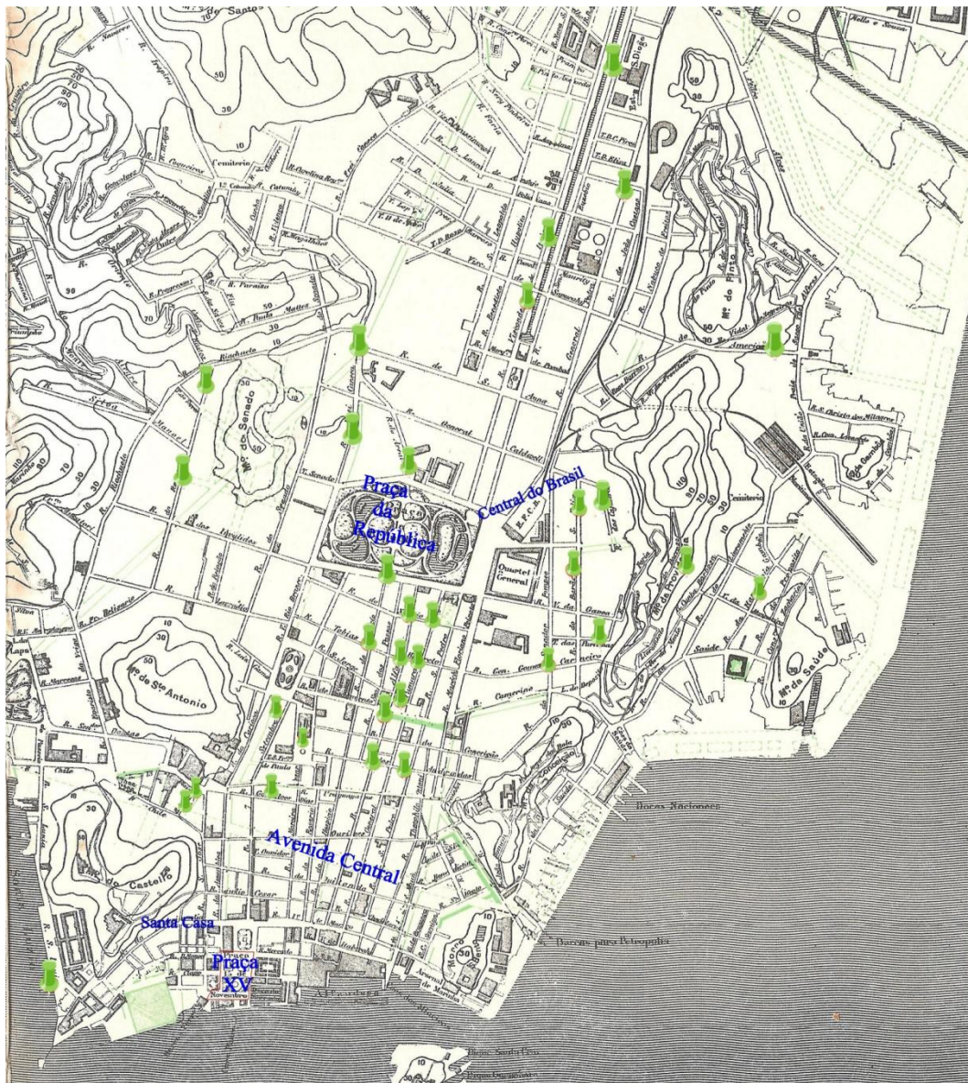
Figura 05 – Candomblés segundo João do Rio