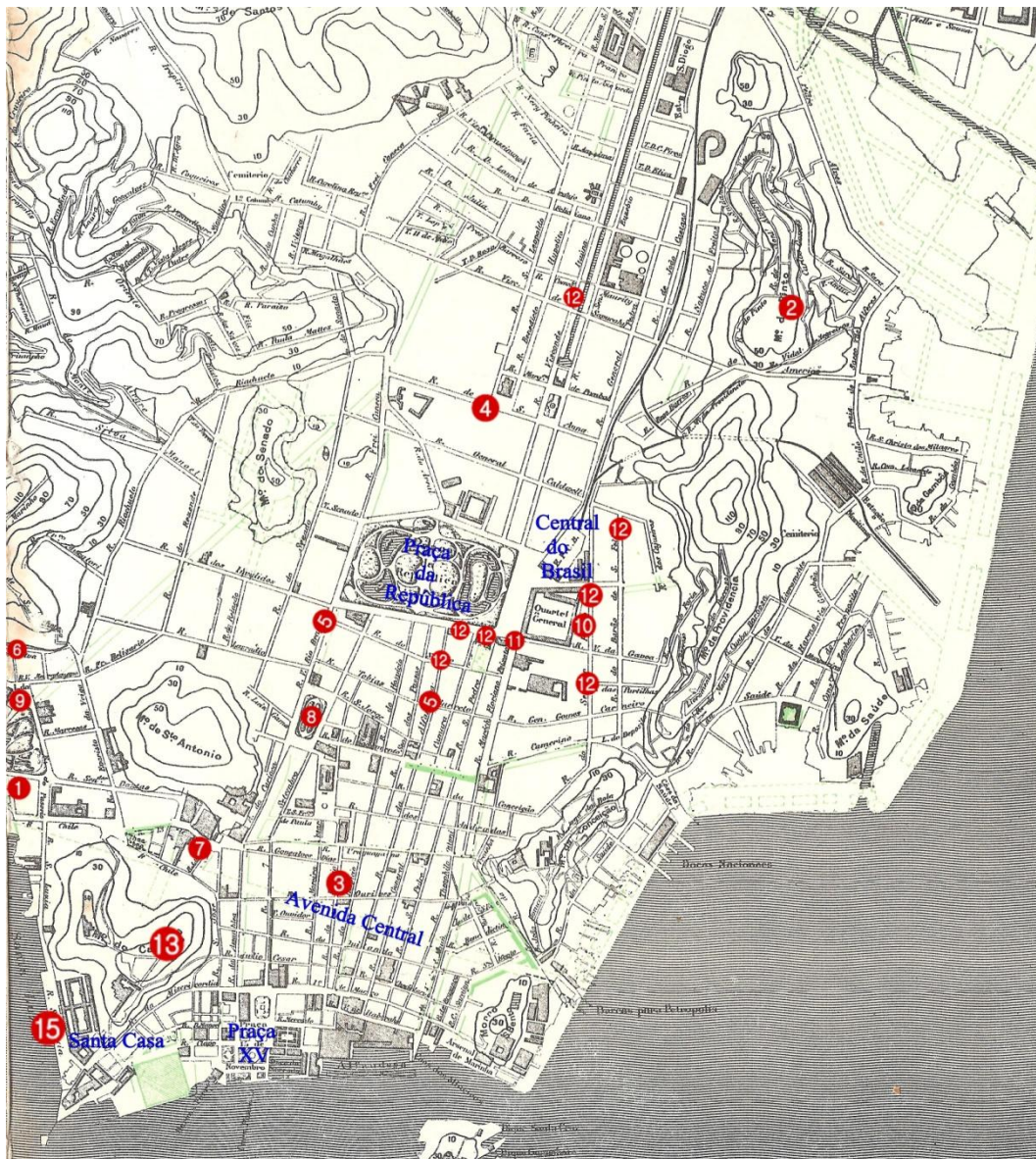
Figura 04 – João do Rio e seus informantes