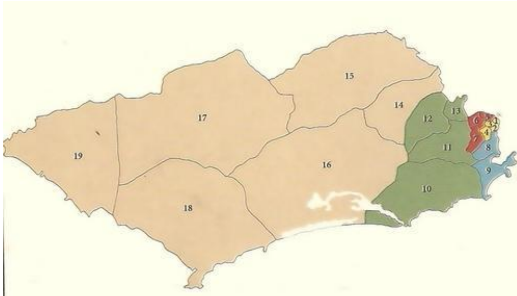
Figura 02 - Freguesias do Rio de Janeiro (1900 – 1910)