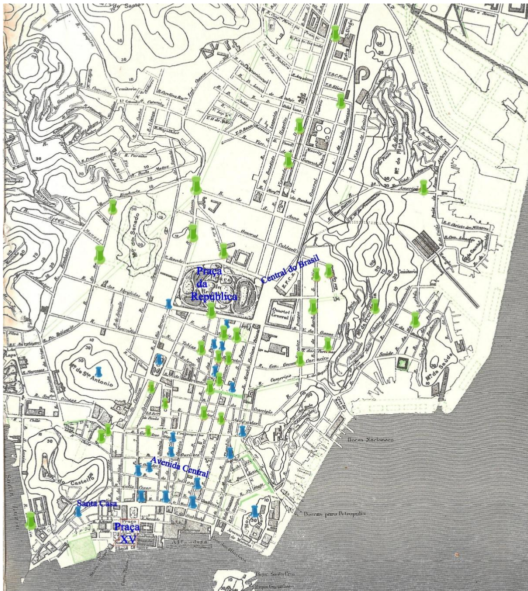
Figura 06 – Candomblés e Igrejas Católicas na região central do Rio de Janeiro