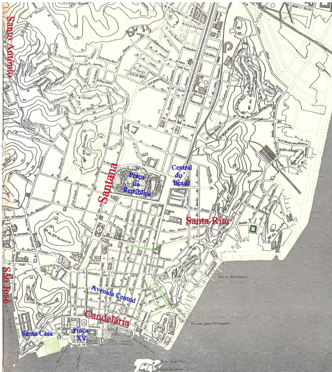
Figura 03 – Região central do Rio de Janeiro e sua divisão em freguesias (1904)