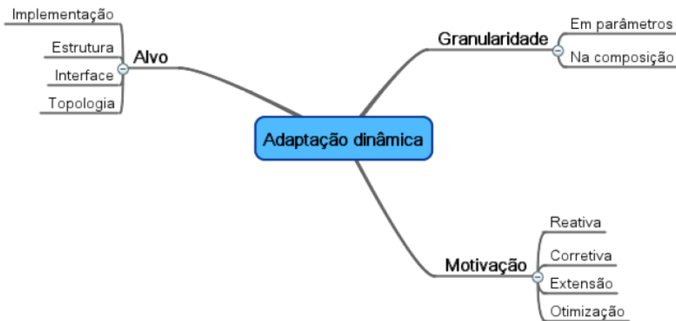
Figura 2: Classificação dos tipos de adaptação dinâmica, segundo [12]

Ao contrário da adaptação paramétrica, a adaptação na composição permite a adoção de algoritmos e componentes desenvolvidos após a implantação da aplicação, oferecendo maior flexibilidade ao desenvolvedor e ao usuário. Este tipo de adaptação é necessário quando existe limitação quanto ao número de componentes instanciados, como em dispositivos com pouca memória, ou quando novas implementações são necessárias para acomodar condições ou requisitos não previstos inicialmente.