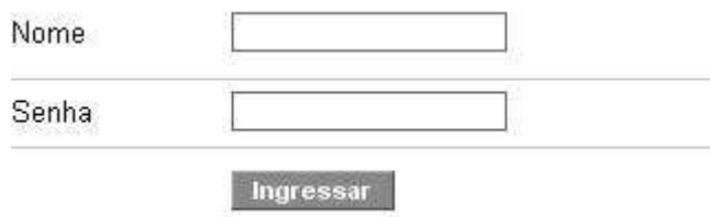
Figura 42 – Tela para “Efetuar autenticação”.

A tela apresentada para autenticação do usuário e a descrição do caso de uso encontram-se, respectivamente, nas figuras 42 e 43.