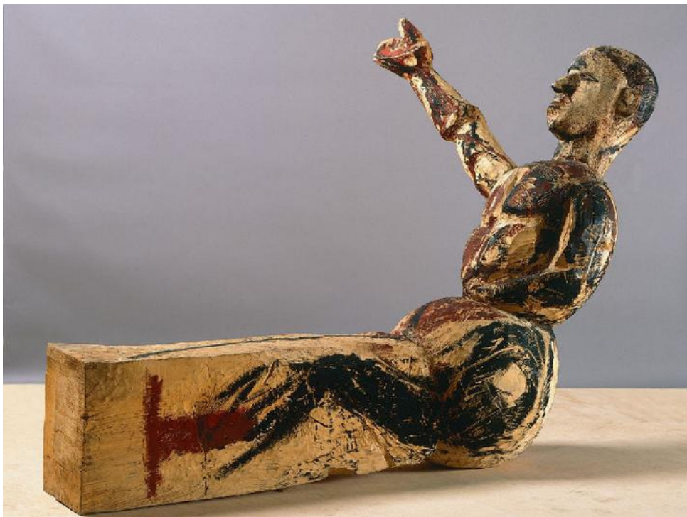
Figura 1 - Georg baselitz, Ein Model für eine Skulptur (Um modelo para uma escultura), 1979-80. Madeira e têmpera, 178 x 147 x 244cm. Museum Ludwig, Colônia.

Visando uma alternativa artística germânica, em 1961 Baselitz havia elaborado juntamente com Schönebeck o 'Manifesto pandemônico' . Inspirados no surrealismo, esses artistas sugeriam com o manifesto o restabelecimento da relação entre arte e vida. Propunham uma arte para além da superficialidade do Belo enquanto valor, e, simultaneamente, contrária à pintura informal, o que foi uma grande novidade nos anos pós-guerra: Baselitz se inspirava, decididamente, na figura. Através dela sua arte de pathos emocional não reproduzia a realidade e sim ampliava a realidade pictórica e plástica.