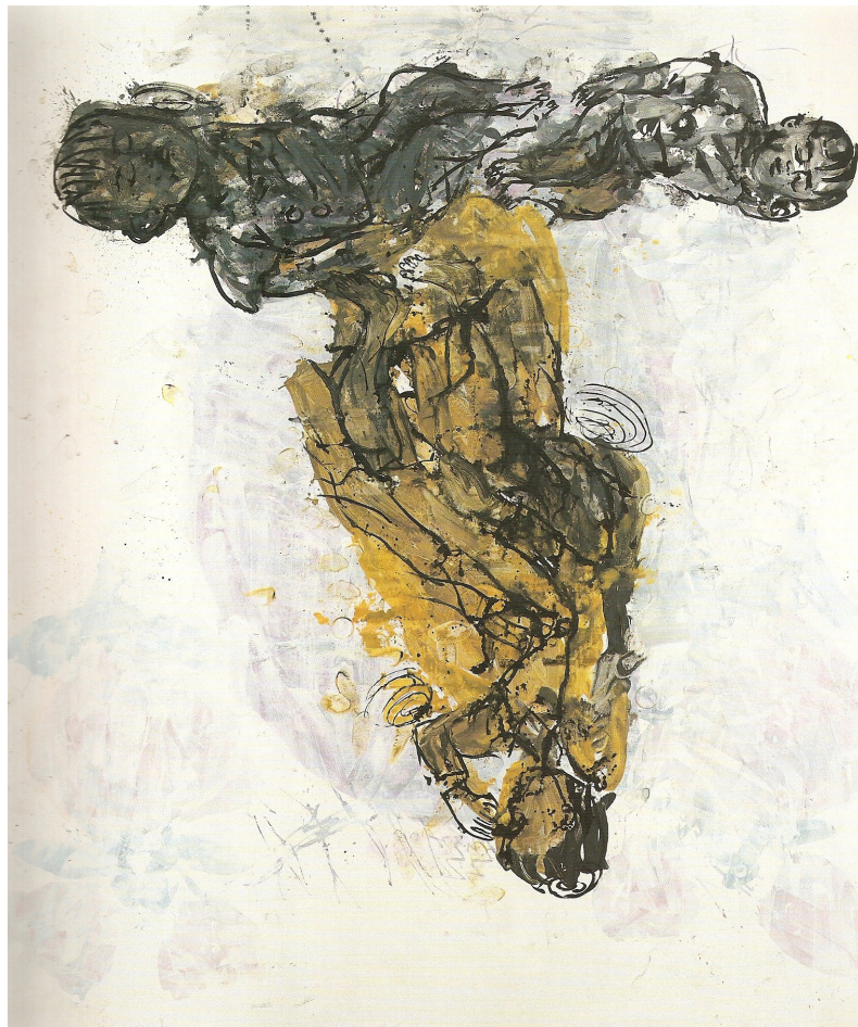
Figura 3 - Georg Baselitz – Melancholie (Melancolia), óleo sobre tela 480 x 395 cm, 1998.

A melancolia desperta um sentimento de ambiguidade que exerce enorme fascínio sobre o pintor e o incita ao mergulho na atividade artística, sem medo do fracasso, provocando situações de destruição que conferem o aspecto inacabado e pulsante a suas pinturas. Elas trafegam entre o luto e a alegria, pulsão de morte e pulsão de vida, realizando um retorno ao 'Eu', onde o isolamento social voluntário, a fuga do mundo e a orientação estética para uma arte independente, outsider, psicótica, são encampadas, a despeito de toda a reação da recepção de sua obra. A situação de tensão bipolarizada representada no manifesto reafirma o papel determinante da melancolia em seu fazer artístico.