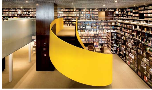
Figura 17 – Livraria da Vila (projeto de Isay Weinfeld)