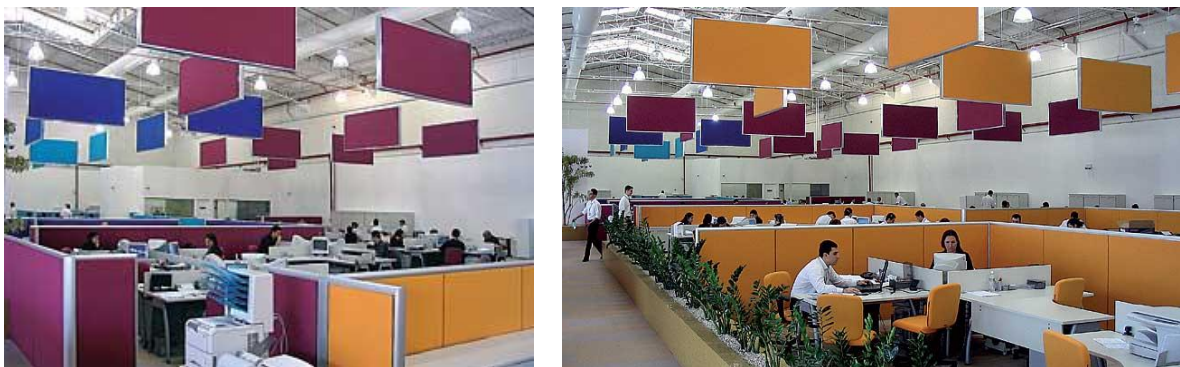
Figura 15 – Espaço organizado – forma e cor – por zoneamento funcional (projeto de Athié Wolnrat).

Esses requisitos visam a legibilidade ambiental, cuja compreensão da configuração arquitetônica e da organização funcional, propicia ao indivíduo definir sua ação. Quanto à organização espacial a cor irá – conforme a figura 15 – reforçar as informações de localização (localizar os ambientes), de identificação (identificar sua função) e de direção (direcionar para onde ir). Quanto ao deslocamento a organização das formas e das cores promove a visibilidade dos caminhos, sem barreiras visuais ou físicas, que possam impedir o deslocamento autônomo.