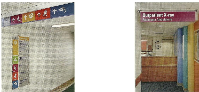
Figura 16 – Codificação cromática da sinalização do Children's Hospital Boston

Os sistemas mais simples de wayfinding utilizam mais as cores para auxiliar a diferenciar zonas, tais como os níveis de um estacionamento de vários andares. Outros sistemas ajudam a visualizar como navegar em espaços maiores ou mais complexos, dentre os quais os bairros ou os edifícios que compõem um grande centro médico. A codificação de cores também pode designar a função de determinado local ou conjunto de ambientes. O importante é que a codificação cromática estabeleça conexões e relações entre os ambientes de maneira tal que facilite a sua localização e os deslocamentos (Figura 16).