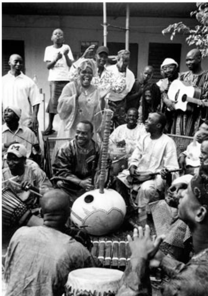
Toumani Diabaté e a Symmetric Orchestra