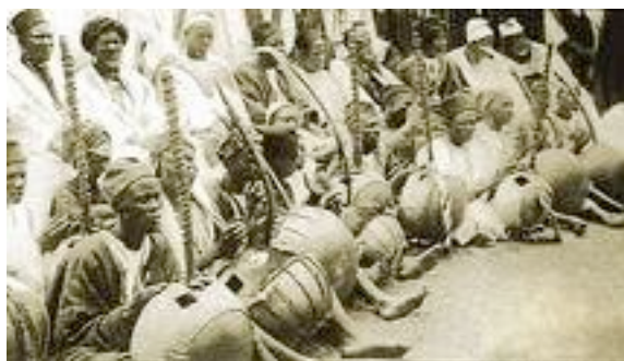
Reunião de griots com seus instrumentos