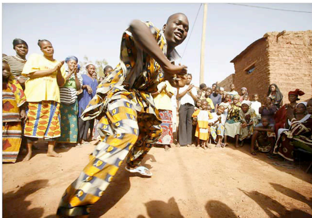
Dança do griot na rua