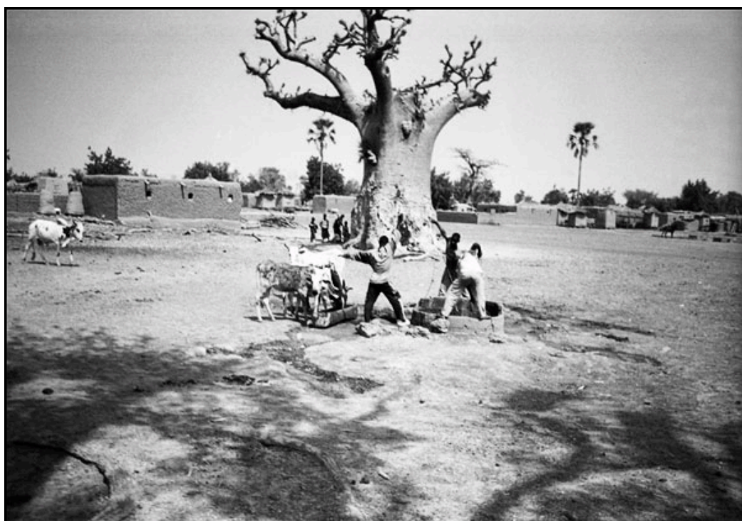
Baobá, árvore sagrada para os griots, lugar onde são enterrados, no interior do Mali