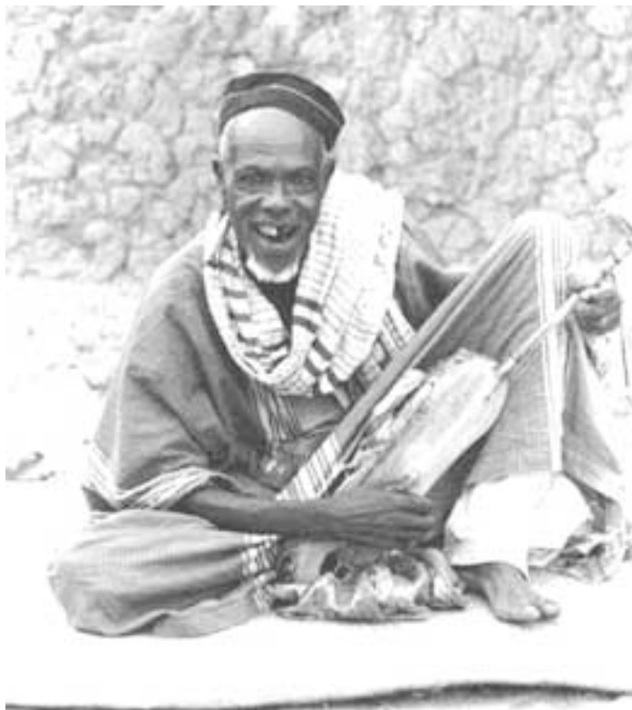
Griot e seu ngoni