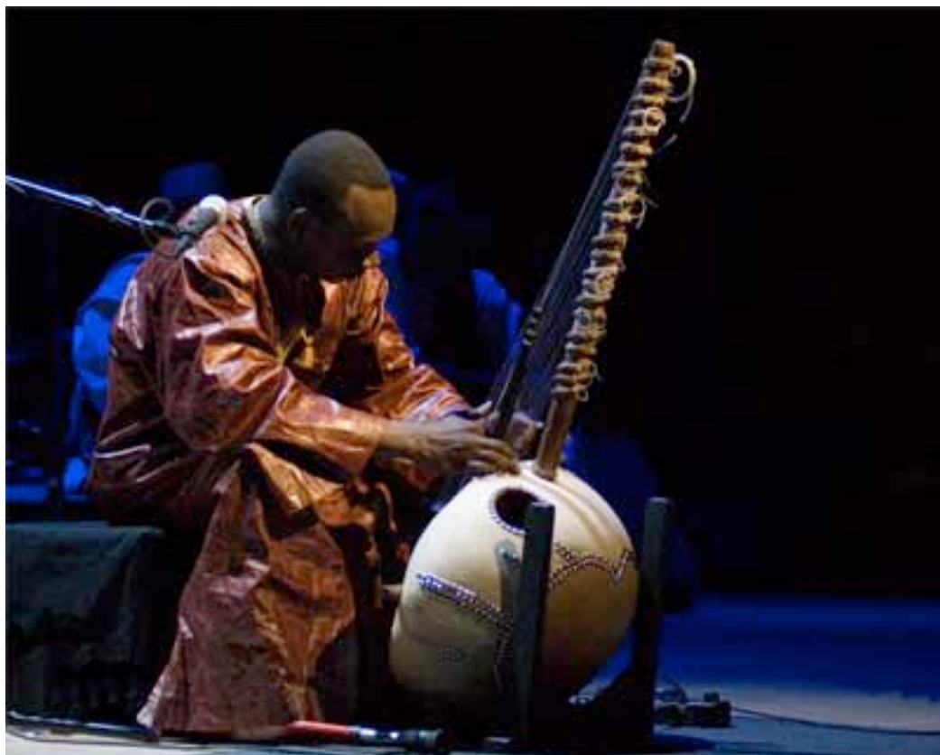
Toumani Diabaté e sua korá