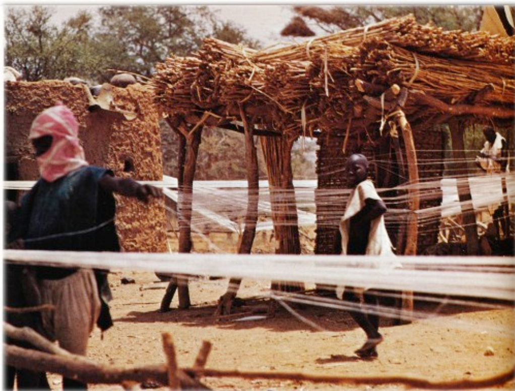
Artesanato, fiação – Mali