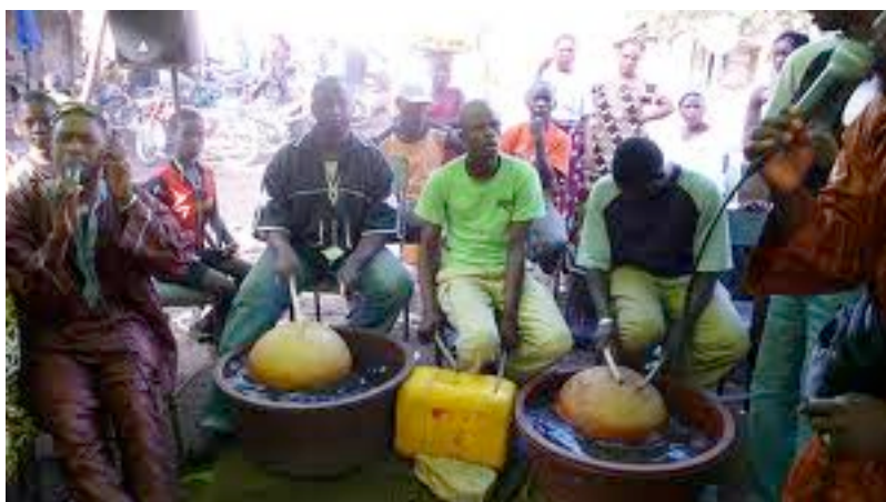
Griots tocando nas ruas de Dakar – Senegal