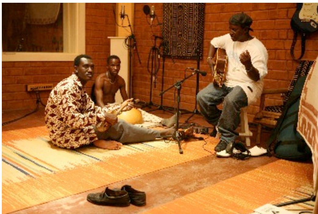
Bassekou Kouyaté em estúdio de gravação