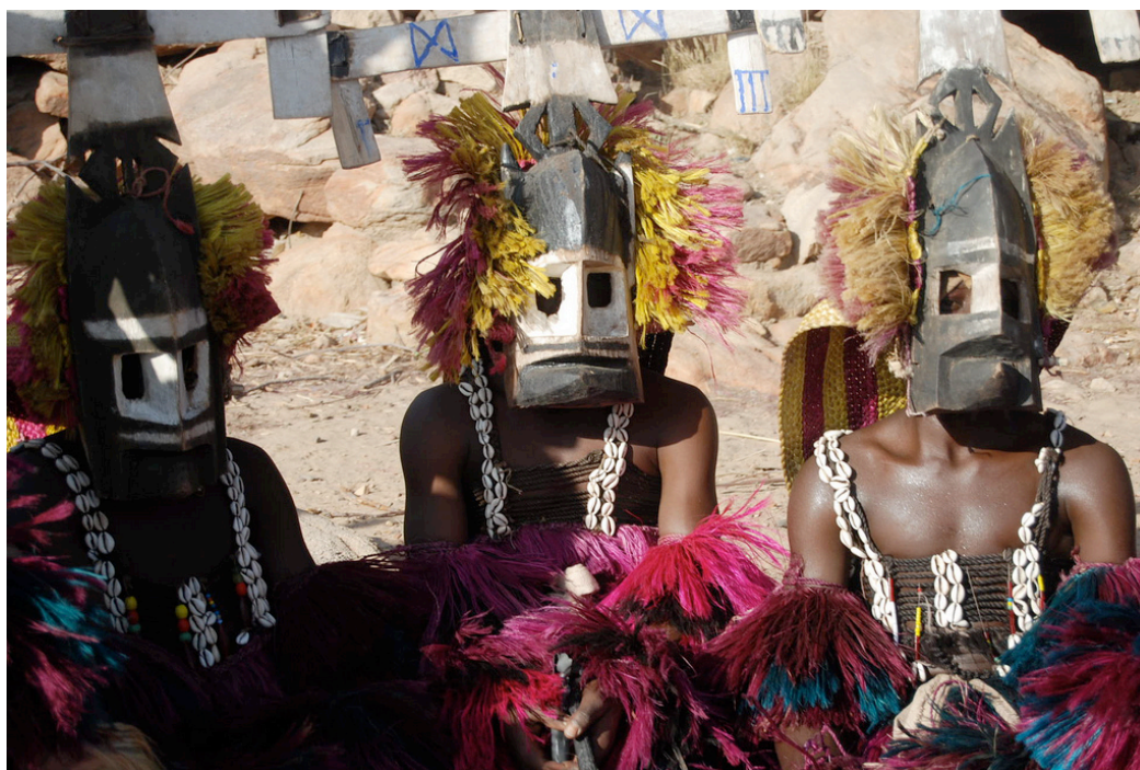
Cerimônia de máscaras do dogon, para o documentário On the griot trail