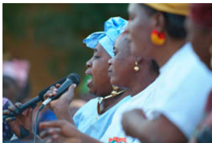
Concurso de griotes em Segou, no Mali