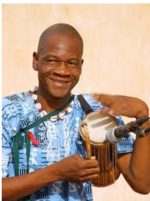
griot e seu talking drum