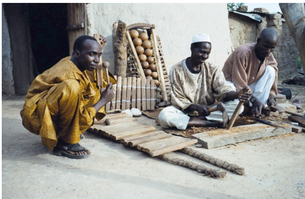
artesãos fazendo o bala , na Guiné