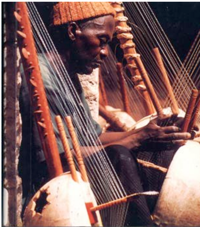
Entre korás, na Nigéria