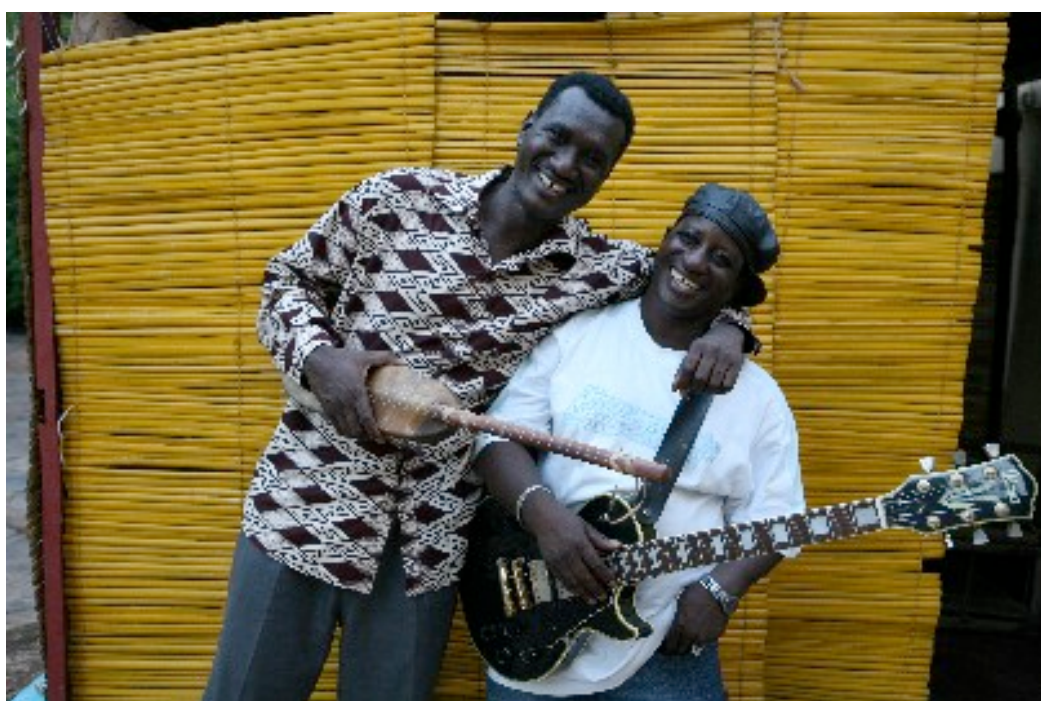
Ngoni e guitarra