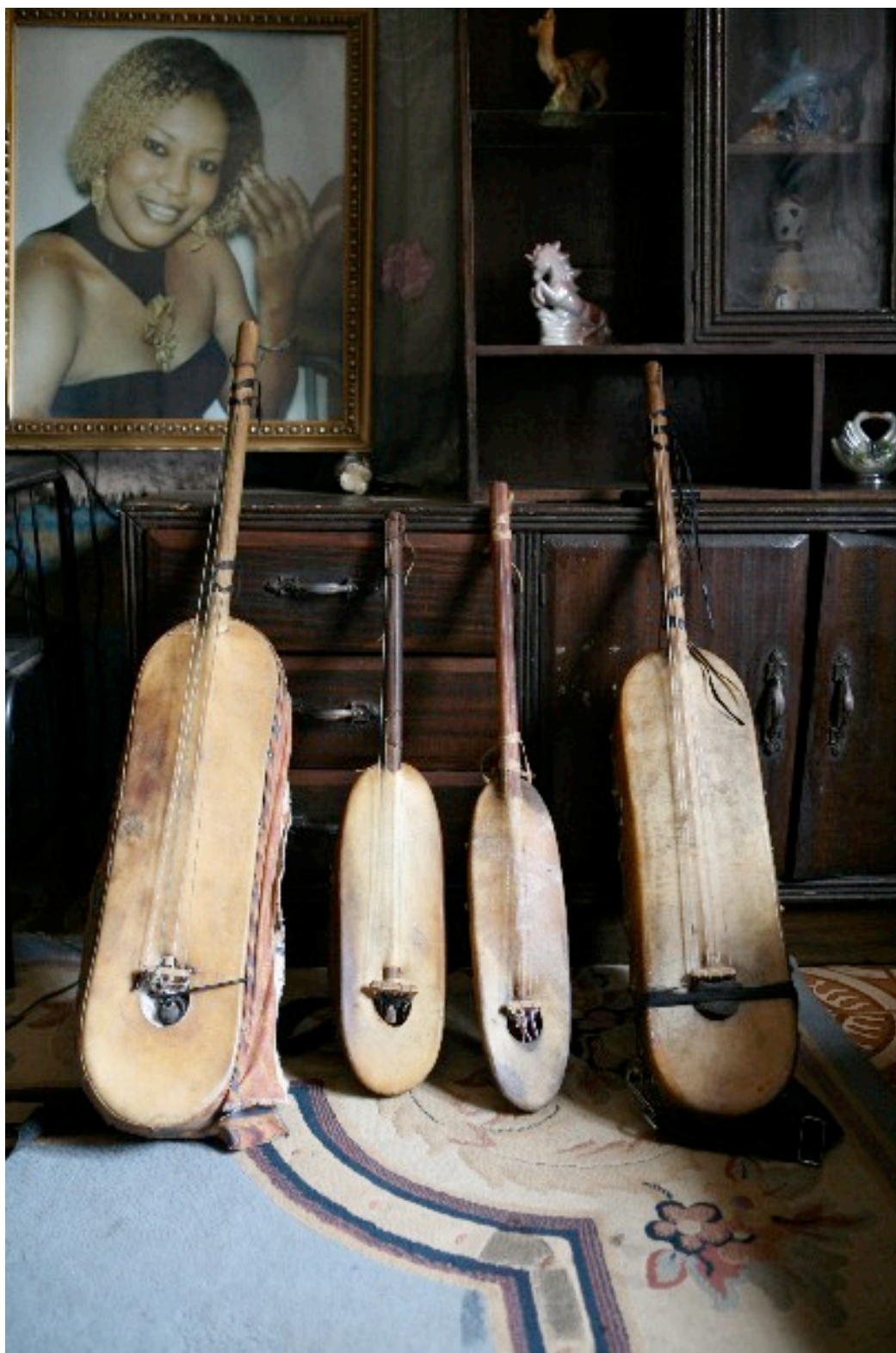
Ngonis na casa de Bassekou Kouyaté