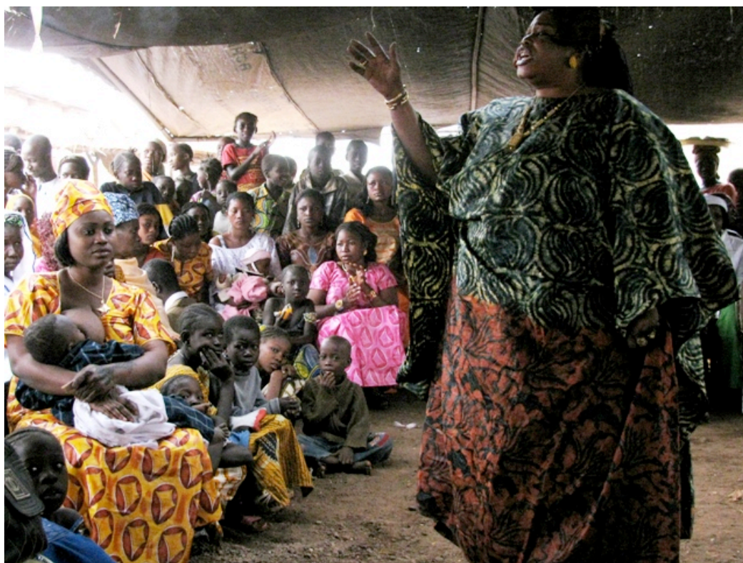
Griote se apresentando