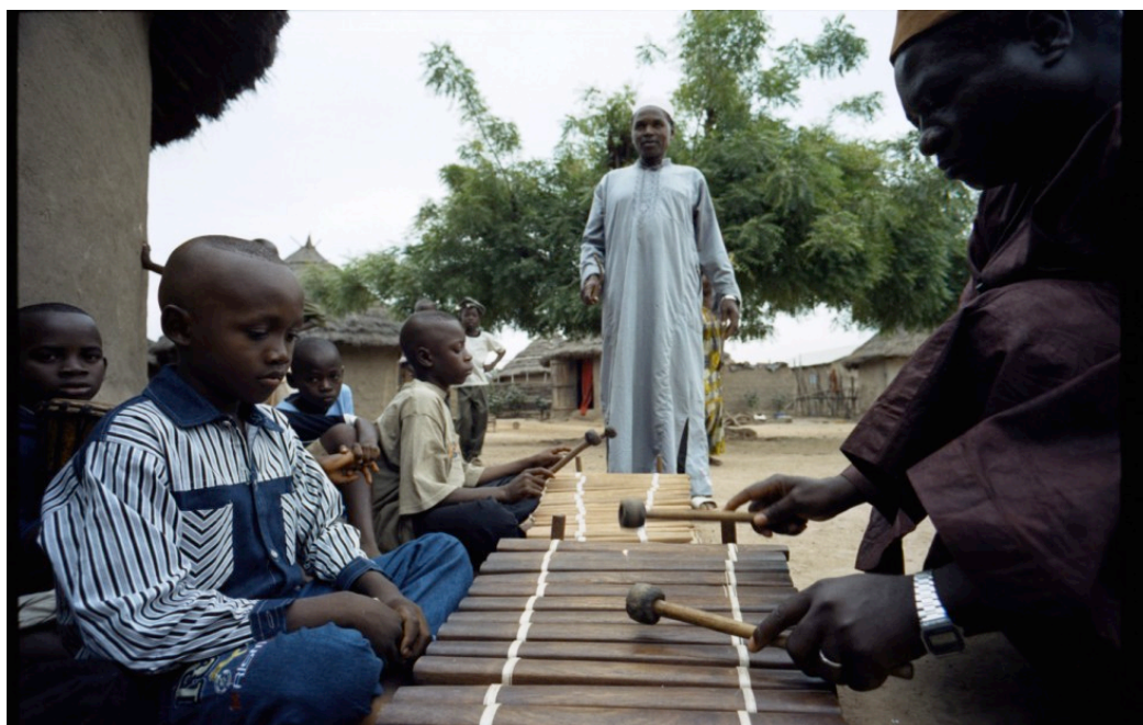
crianças ouvindo o bala , na Guiné, onde está o Bala de Sosso