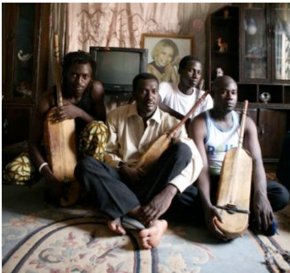
Bassekou Kouyaté & Ngoni Ba