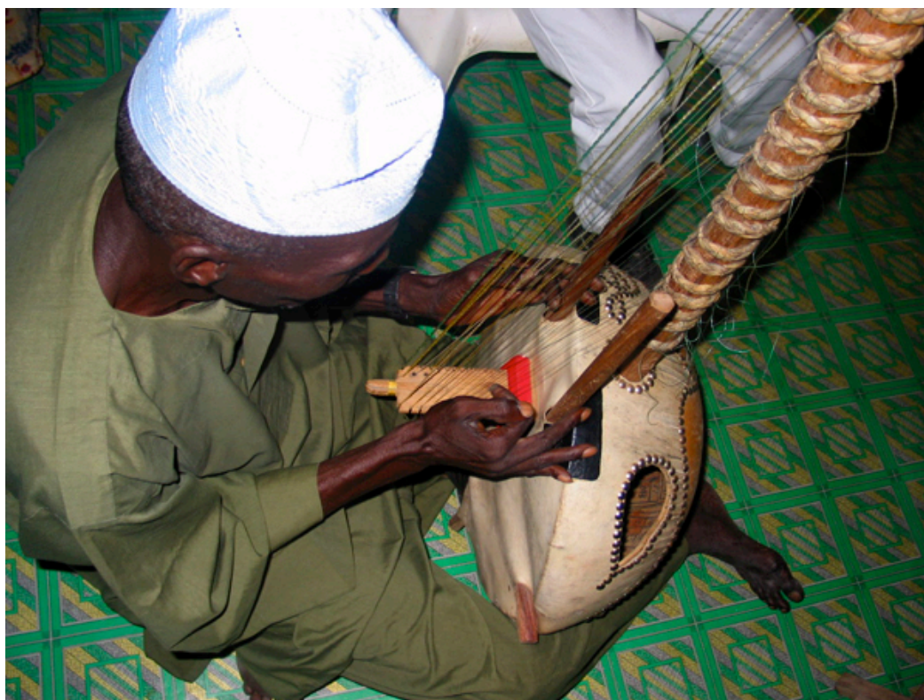
Griot tocando a korá