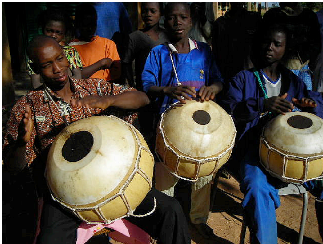
griots numa atividade escolar em Ougadougou – Burkina Faso