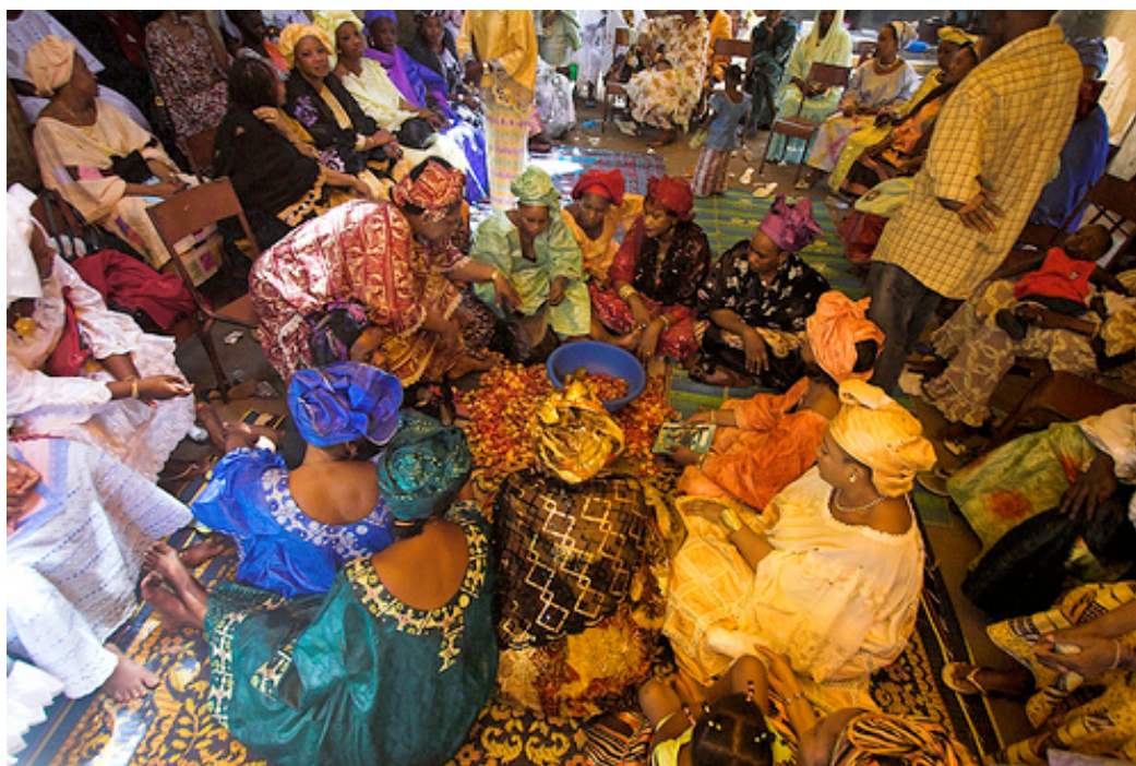
Festa em Bamako