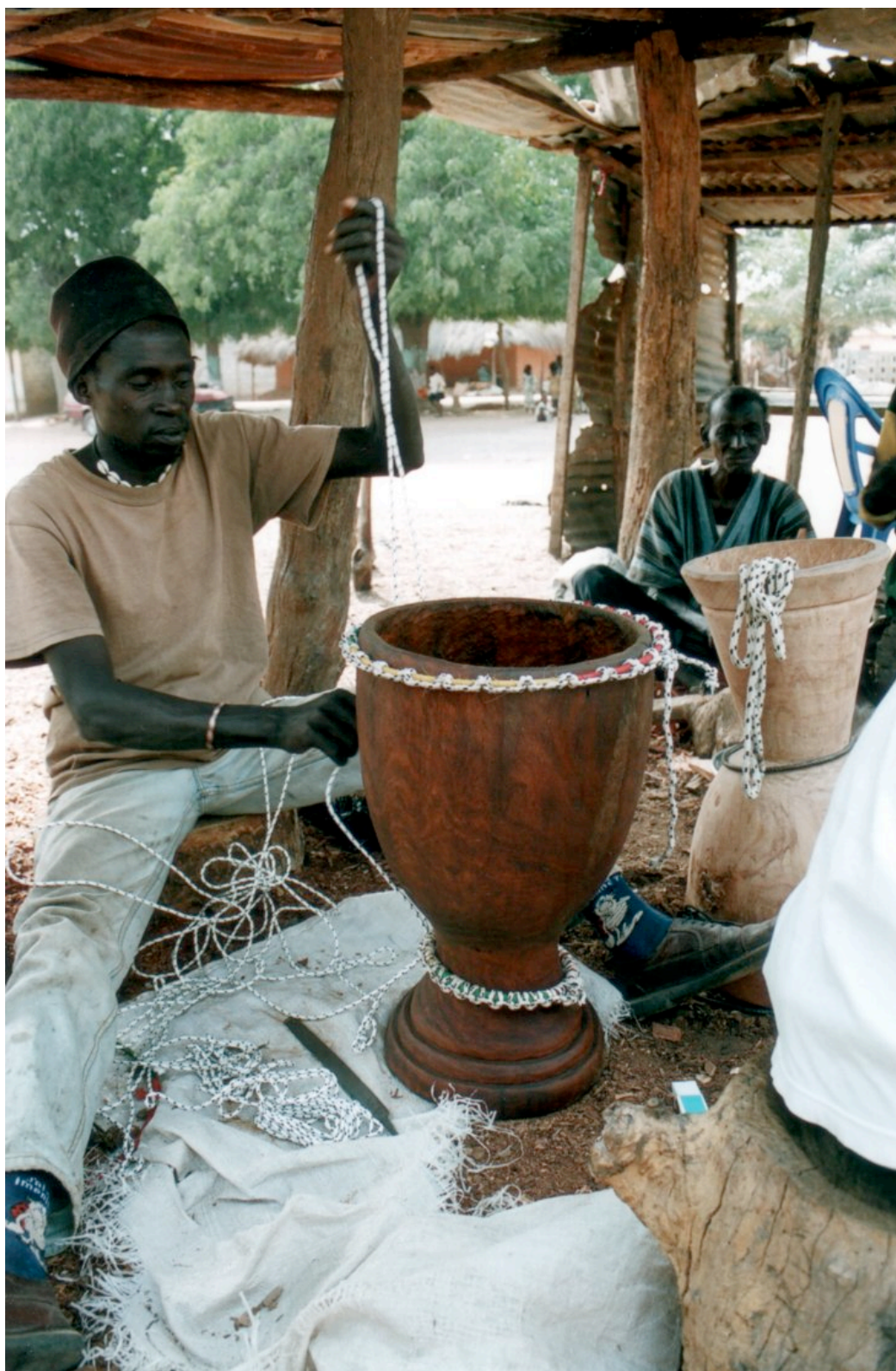
Escola de djembês, no Senegal - artesanato