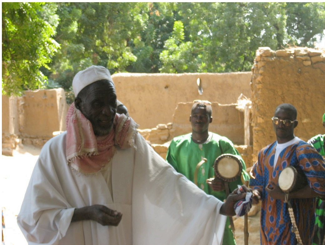
Griots e seus talking drums