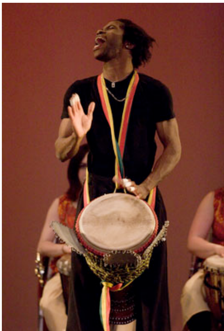
Salif Koné, griot de Burkina Faso músico e dançarino