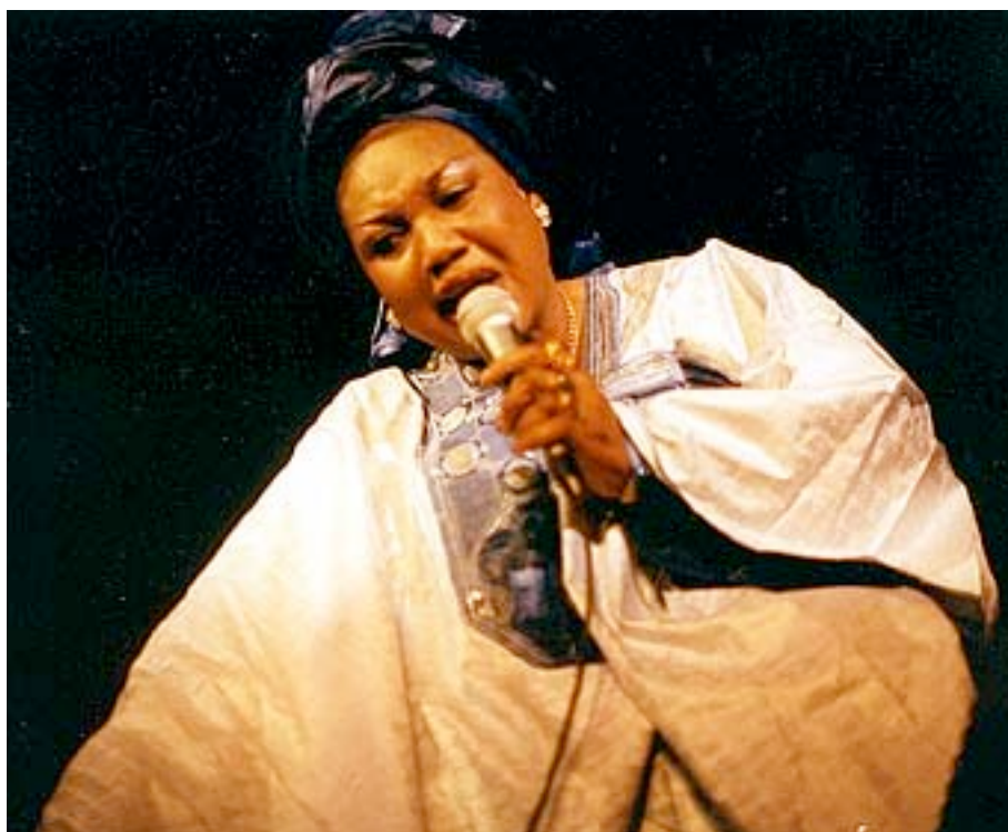
Griote se apresentando, infelizmente não consegui achar seu nome.