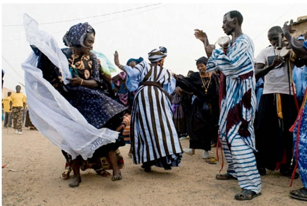
Festival de música e dança, no Mali