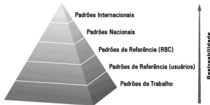
FIGURA 15 – Pirâmide de rastreabilidade[23]

Comparabilidade metrológica: “Comparabilidade de resultados de medição que, para grandezas de um tipo determinado, são rastreáveis metrologicamente à mesma referência.” Vocabulário Internacional de Metrologia: Conceitos Fundamentais e Gerais e Termos Associados (VIM 2008)