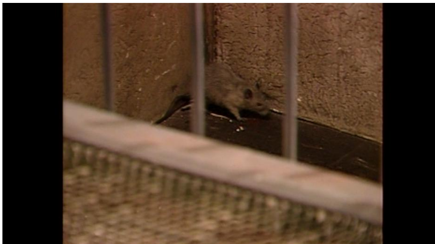
Figura 11 – Rato no quarto de Juliana

Quando chega a seu quarto, levada pela outra criada, Joana, a cena que se nos mostra é a seguinte: