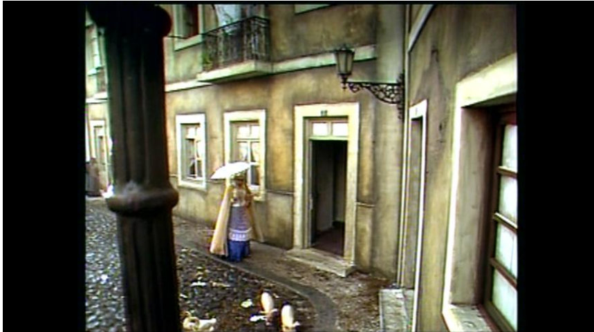
Figura 1 – Luísa e o Paraíso 19

Nesta cena, vemos o momento em Luísa chega ao Paraíso pela primeira vez. Note-se que a reconstrução foi criteriosa, como se pode ver também nas fotos a seguir.