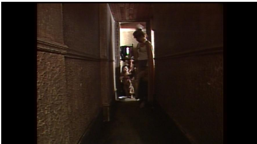
Figura 2 – Luísa e o corredor do Paraíso

Nesta cena, vemos o momento em Luísa chega ao Paraíso pela primeira vez. Note-se que a reconstrução foi criteriosa, como se pode ver também nas fotos a seguir.