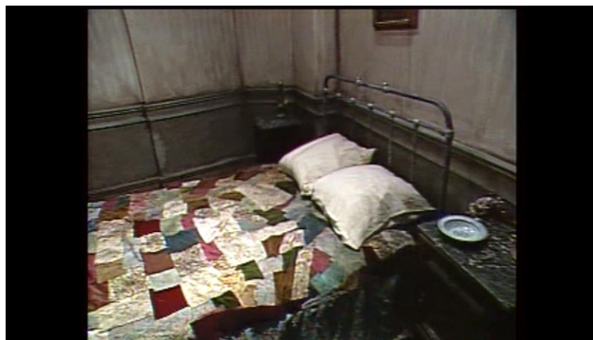
Figura 3 – A cama do Paraíso