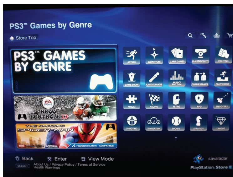
Figura 2.1: Classificação de jogos por gêneros na Playstation Store.

O uso de taxonomias de jogos, além de importante para o aspecto de estudo do campo, tem uma importância para a venda de jogos. Ao separarmos e agruparmos jogos segundo determinadas classificações, permite-se que o consumidor e futuro jogador escolha o jogo baseado em comparações com jogos de uma mesma família e entre famílias diferentes. Um exemplo é a classificação por gêneros da Playstation Store da Sony, Figura 2.1, que divide os jogos em: ação, aventura, jogos de cartas, PS Eye 2 , luta, game show 3 , Playstation Move 4 , música e ritmo, jogos online, plataforma, puzzle , corrida, retro 5 , RPG, shooters , shooting 6 , simulação, esporte, estratégia, únicos 7 e jogos 3D (não exibido na Figura 2.1).