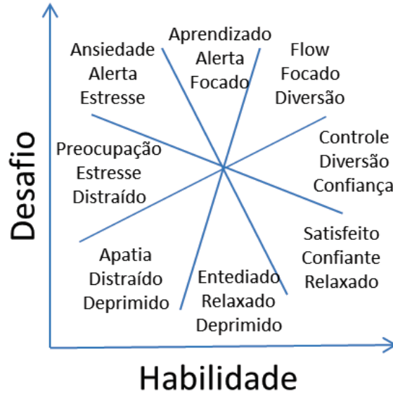
Figura 2.3: As oito dimensões da experiência. Adaptada de (Cowley08)