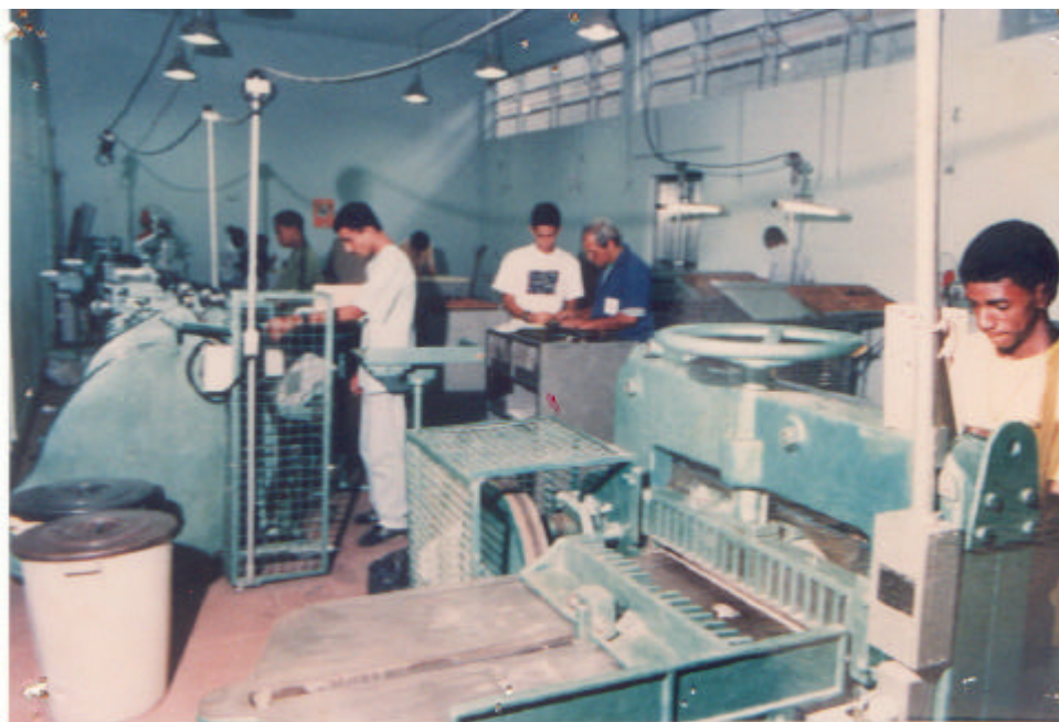
Foto: Internos em atividades laborativas