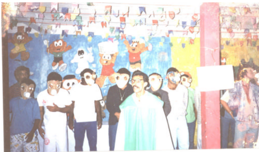
Foto: Evento na escola da ex-Penitenciária Candido Mendes

Somos seres mutantes, corpos e pensamentos que se transformam a cada instante. Produtos do alimento que comemos, resultado da educação que recebemos. Tudo se transforma, nada é constante. Já não somos agora o que éramos há um instante. Hoje sabemos o que antes não sabíamos. Sabíamos que nada sabemos, aprendemos todo dia. Sabemos ou não sabemos? Que a vida é corpo e pensamento e que precisa de alimento. Dor, alegria, sentimentos, por isso havia lágrimas no rosto que chorava ou que sorria. Temos que nos educar, mudar a nós próprios para o mundo transformar. Pois com tanto saber é um absurdo que, enquanto muitos têm pouco, poucos tenham tudo.