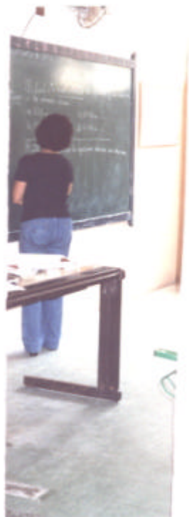
Foto: Professora dando aula na E. E. E. S. Mário Quintana