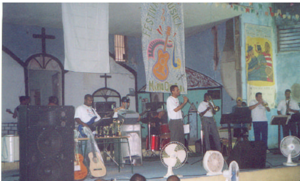
Foto: Festival de Música desenvolvido pela E.E.E.S. Mário Quintana