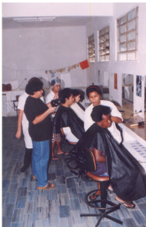
Foto: Curso Profissionalizante desenvolvido pela Fundação Santa Cabrini em 1998