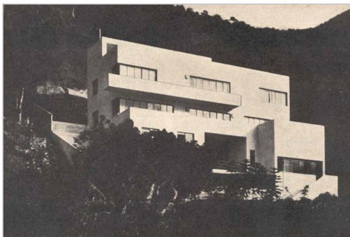
Figura 1. Casa Nordschild. 1931

Pode-se de fato, falar de um estilo Warchavchik, que atingiu o apogeu nesse exato momento. Inspirado nas teorias de Le Corbusier, fundia intimamente o funcionalismo e o cubismo arquitetônicos, em moda na década de 20. A evolução iniciada com a casa de Max Graf prosseguiu nas obras posteriores. Acentuou-se o caráter plástico, sem afetar a austeridade do conjunto: o tema da grande marquise, formada por duas lajes de concreto armado, foi retomado na casa modernista de São Paulo; deu-se um passo a mais na casa do Rio, onde a forte inclinação do terreno possibilitou não apenas a justaposição, mas a interpenetração dos volumes, completada pela projeção da laje em balanço do balcão, que ultrapassa o plano da fachada. Entretanto, o objetivo dessas audaciosas inovações não era em princípio de ordem estética; visava principalmente mostrar todas as possibilidades que o concreto armado possibilitava, liberando o arquiteto e permitindo-lhe concentrar-se na solução dos problemas funcionais. Não se procurava a forma a priori, nem a forma pela forma – ela era o resultado lógico de um programa coerente: habitação clara, com os ambientes amplamente voltados para o exterior, prolongados na medida do possível por terraços e balcões.” 9 .