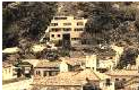
Figura 3. Constraste entre o padrão das construções da época e a Casa Nordschild. 1934.

Ao lado da menção a Casa Nordschild, encontra-se uma fotografia em destaque da sua fachada, com a legenda “Residência na rua Tonelero, projeto do arquiteto Warchavchik. A primeira casa de arquitetura moderna construída no Rio de Janeiro”. A importância da inserção da Casa Nordschild nesse livro, diz respeito não apenas ao fato de ele ser fruto de uma pesquisa minuciosa sobre a história de Copacabana, mas, justamente, porque nela a casa encontra-se contextualizada no processo de crescimento do bairro, mostrando como ela representa um corte e uma ruptura em relação ao padrão das construções da época. Esse fato torna-se gritante aos olhos quando se comparam as imagens fotográficas da paisagem residencial do bairro, naquele momento.