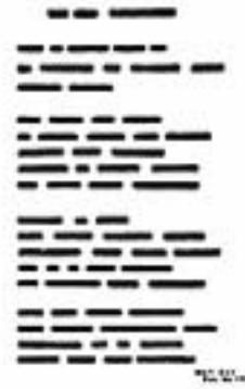
Man Ray, Poema sonorista, 1924