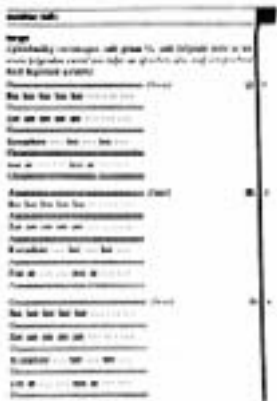
Kurt Schwitters, excerto da partitura da "Sonata primordial", 1924-25