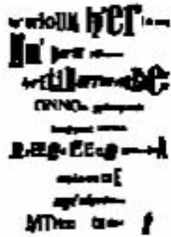
Raoul Haussman, Poema optofonético, 1918