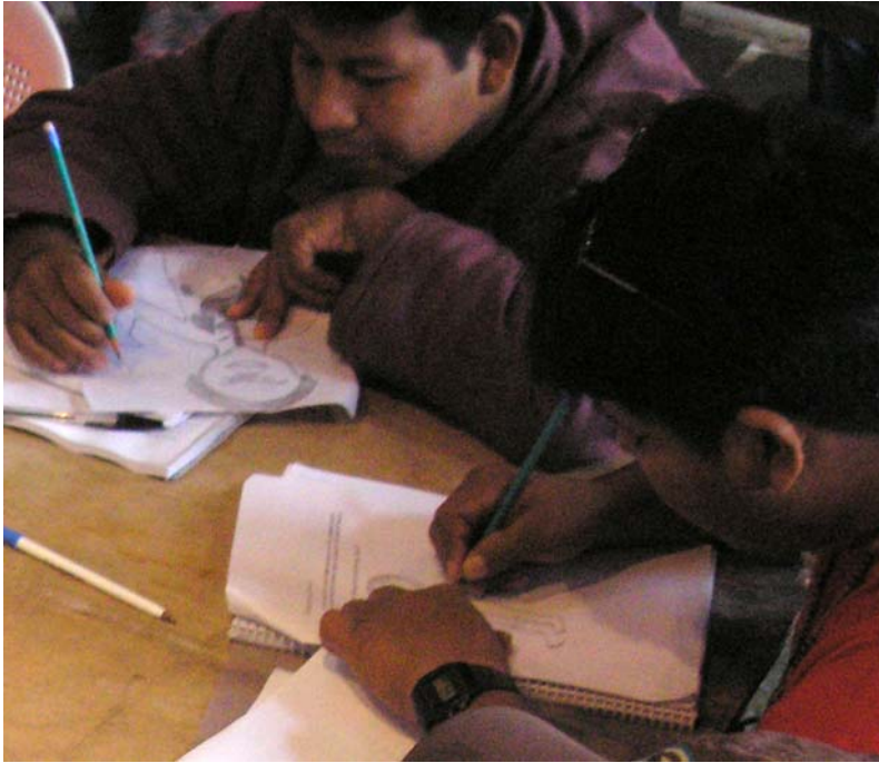
Figura 2 Cursistas ilustrando os órgãos na aula de Ciências.

utilizou os ovos de páscoa, parte da compreensão dos exercícios passava pela representação visual esquemática da disposição dos cursistas em relação à quantidade de ovos.