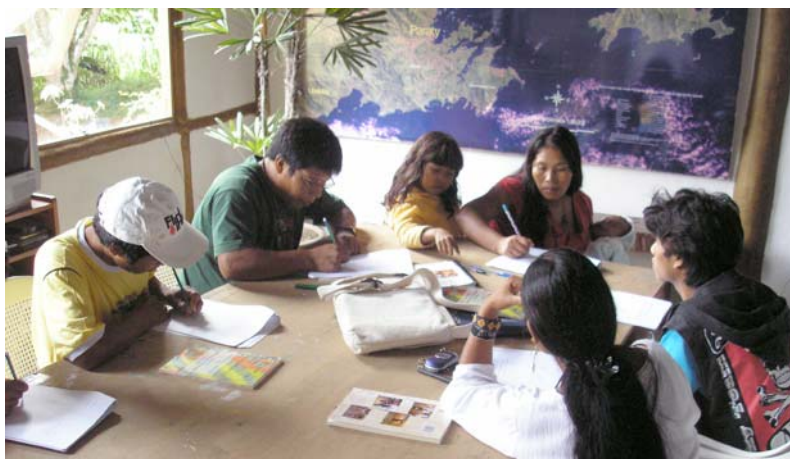
Figura 1 Cursistas resolvendo atividades no caderno

Os Cadernos Paradidáticos, distribuídos no início do encontro de cada mês, permanecem sempre abertos sobre as mesas e são constantemente consultados pelos professores Juruá e pelos cursistas. Por vezes, os professores Juruá pedem aos cursistas que leiam o texto em voz alta, intercalando a leitura com explicações e discussões. Outras vezes, como no caso da professora de Matemática, o Caderno é utilizado para a proposição de atividades que envolvem a observação, resolução e registro dos exercícios (Figura 2). Destarte, em todas as aulas observam-se atividades de leitura e escrita executadas por meio do Caderno Paradidático.