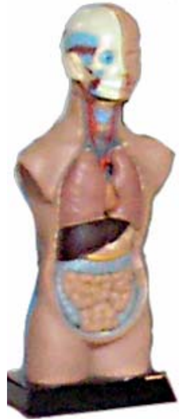
Figura 4 Boneco antropomórfico utilizado nas aulas de Ciências