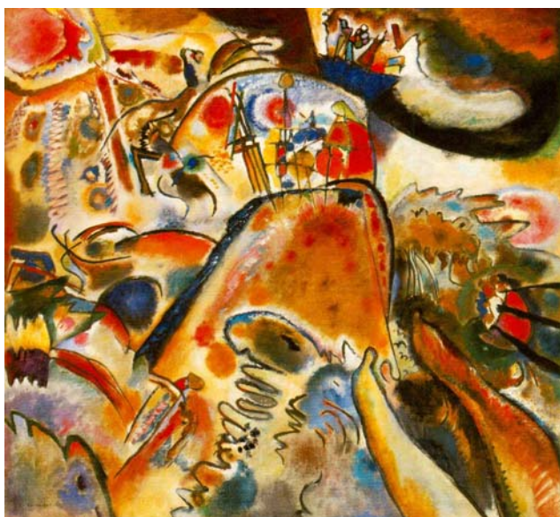
Figura 11 – Little Pleasures (1913) Wassily Kandinsky

Retirando-se para Murnau, uma cidade no sul da Alemanha, em 1908, o estilo de Kandinsky imediatamente começa a mudar. Da paisagem da cidade, o artista retira as formas essenciais que usara na planificação de suas composições, exagerando os ritmos que dançam por toda tela, usando linhas poderosas e pintando com cores fortes; assim, seus trabalhos repercutem tensão espiritual, suas paisagens contêm uma força capaz de libertar o familiar de seu contexto reconhecível.