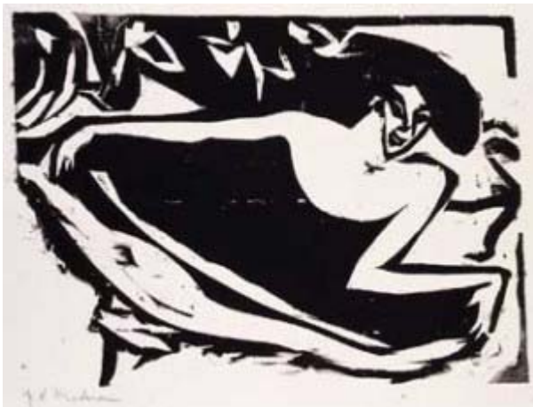
Figura 9 – Dançarinas (1909, xilogravura) Ernst Ludwig Kirchner

Die Brücke é uma formação compacta, verdadeira comunidade de artistas com programa escrito, que não diferia muito do da Werkbund. Principais expoentes são: Kirchner, Heckel, Nolde, Schmidt-Rottluff, Müller, e o escultor Barlach. Propõe a união dos “elementos revolucionários em efervescência” num embate anti-impressionista (combate-se mais o reflexo pálido que este movimento obteve na Alemanha do que a vertente francesa). “Ao realismo que capta, contrapõe-se um realismo que cria a realidade. Para ser criação do real, a arte deve se despojar de tudo que existe anteriormente à ação do artista, que precisa recomençar a partir do nada. E sua experiência de mundo não difere, na origem, da de qualquer outra pessoa: os temas expressionistas costumam estar ligados à vida cotidiana – mas em suas obras pode-se perceber incômodo, certa rudeza, como se o artista nunca tivesse pintado antes em sua vida. Há uma recusa da linguagem já constituída, a expressão se dá de modo penoso, sem nuances” (ARGAN, 1992, p.). Argan justifica tais fatos dizendo que na origem da linguagem, há apenas sons que assumem um significado. O Expressionismo alemão pretende ser precisamente uma pesquisa sobre a gênese do ato artístico: no artista que o executa e, logo, na sociedade a que ele se dirige.