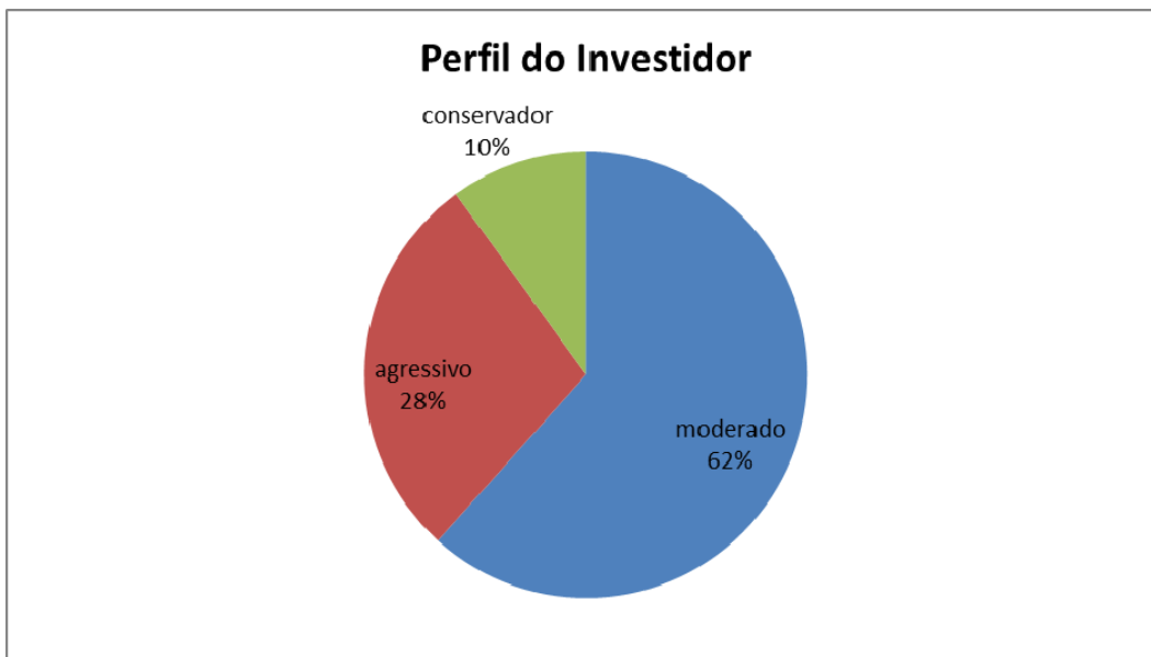
Figura 3: Perfil do Investidor

O Gráfico abaixo apresenta um resumo dos resultados encontrados em relação ao perfil dos respondentes: