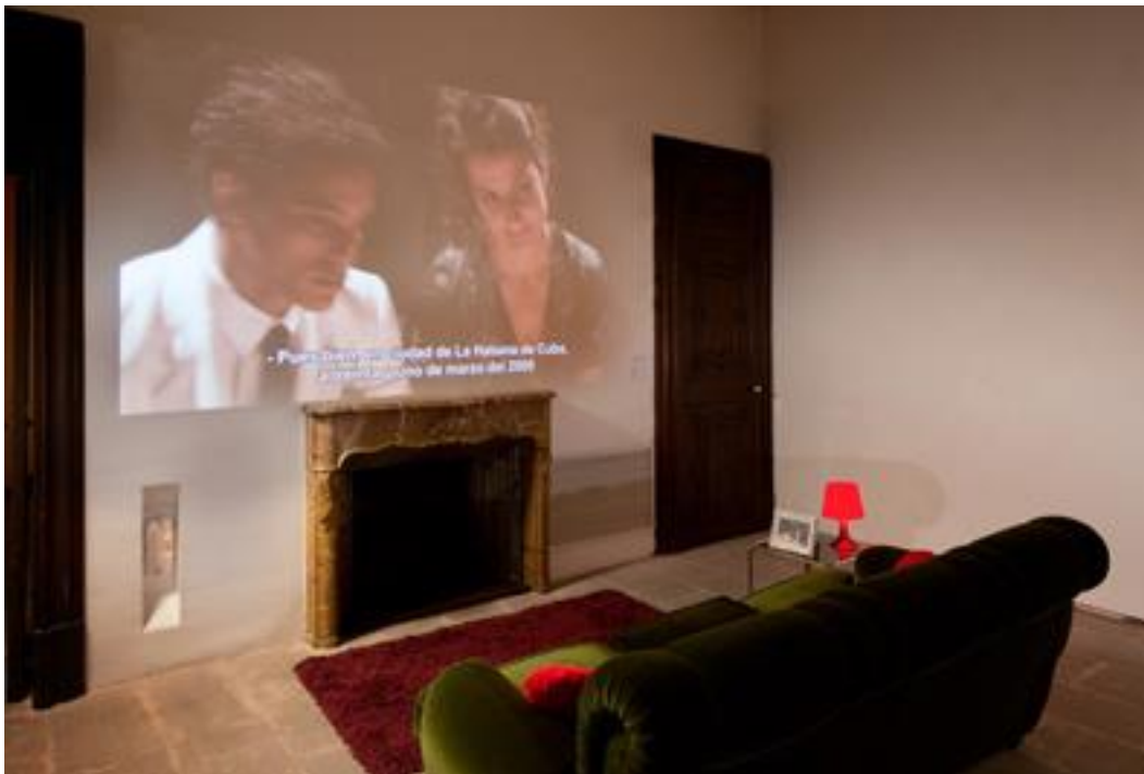
Figura 18: Registro de instalação da obra "Ajuda Humanitária", de Núria Guells

Toda a produção de Núria Guell está baseada na pesquisa de atuação de mecanismos paralelos para criar estratégias de controle que envolvam tomadas de subjetividade, influenciando nossos padrões de comportamento, pensamento e significado. Suas investigações surgem com o objetivo de quebra ou criação de crises para o sistema legitimador, criando outras realidades possíveis.